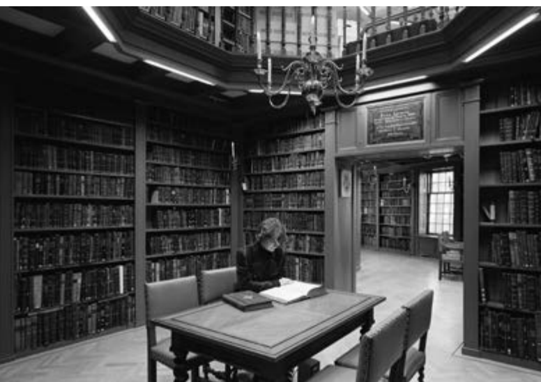
De eeuwenoude bibliotheek is nog altijd een plaats van studie.

Behalve een grote collectie boeken bezit Ets Haim-Livraria Montezinos een belangrijke collectie manuscripten en gravures. In de oorlog zijn de belangrijkste bezittingen verborgen en is de rest afgevoerd naar het Institut zur Erforschung der Judenfrage in Frankfurt, dat tot doel had de joodse cultuur te bestuderen nadat de joden in Europa waren uitgeroeid. De