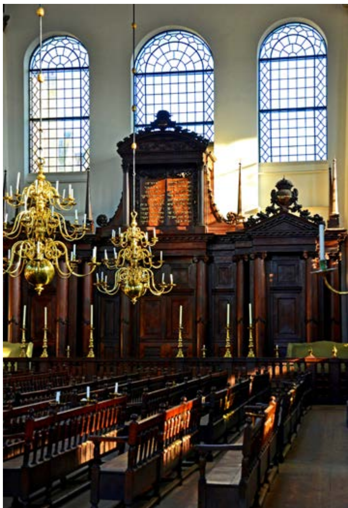
Interieur van de Portugese synagoge met de heilige ark.