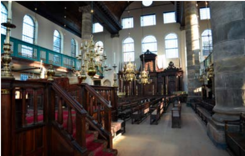
Interieur van de Portugese synagoge met teba en hechal.

In de diaspora heeft nooit een specifiek joodse bouwstijl bestaan. Gewoonlijk werd de plaatselijk gangbare bouwstijl