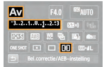
Diafragma voorkeur, Belichtingscompensatie (+1 Ev) en Matrixmeting (v.l.n.r.).

In plaats van het belichtingsprogramma Diafragma voorkeur (A-stand) kunt u ook kiezen voor Program (P-stand). U heeft dan met Belichtingscompensatie nog steeds volledige controle over de belichting van uw opnamen, maar u hoeft zich geen zorgen meer te maken over het diafragma en u kunt uw aandacht volledig richten op het onderwerp. Wilt u alles over de P-stand weten, zoals bijvoorbeeld Program Shift, kijk dan eens naar dit artikel op EOSzine.nl: http://bit.ly/1xdDR5k