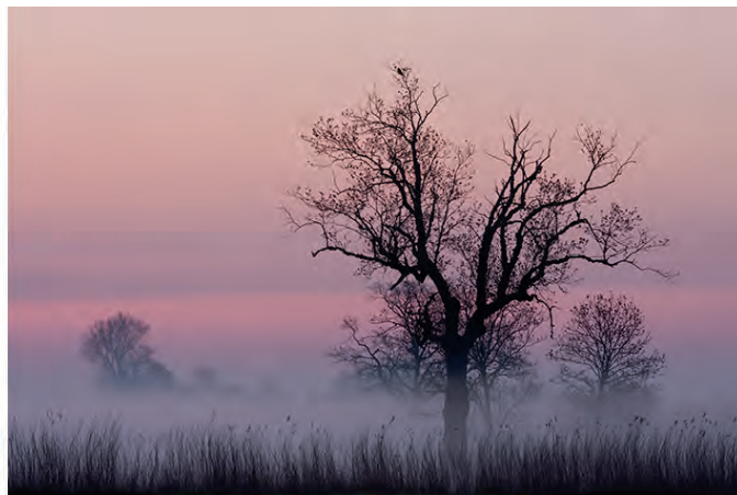
Zelfde onderwerp overdag of 's ochtends vroeg.