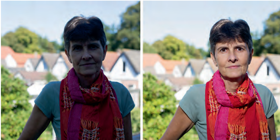
Buitenopname bij 'voldoende' licht. Niet geflitst (l) en met invulflits (r).

dwing je de camera dan toch om te flitsen. Het bestaande licht maakt dat de achtergrond - buiten het bereik van de flitser - goed belicht is en het flitslicht zorgt voor de juiste helderheid van het hoofdonderwerp. Deze techniek wordt Invulflitsen genoemd.