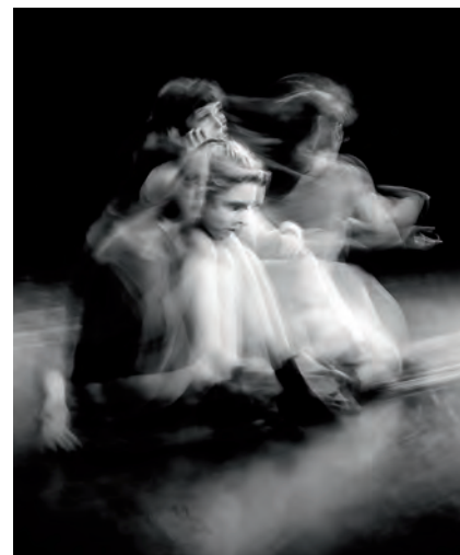
Snel een foto nemen van een 'snel' onderwerp. Gelukt of mislukt?

Met een halsriem, volle accu (+ reserve) en leeg geheugenkaartje (+ reserve) is de kans op een misser al een stuk kleiner. Als u dit lijstje met voorzorgsmaatregelen nog aanvult met een goede cameratas, dan beschermt u tevens uw kostbare apparatuur tegen stoten, vuil en vocht en hebt u er langer ongestoord plezier van. Hebt u toch een mankement aan uw camera of lens, kijk dan of dit onder de garantie valt. Zorg daarom dat u altijd de originele rekening en de complete verpakking netjes bewaart.