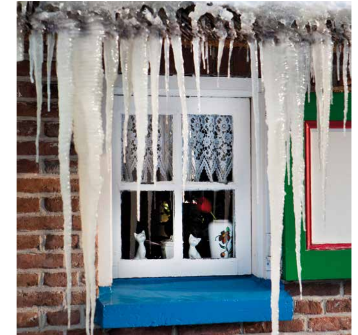
Grote ijspegels hangen aan het rieten dak van deze boerderij in Staphorst.