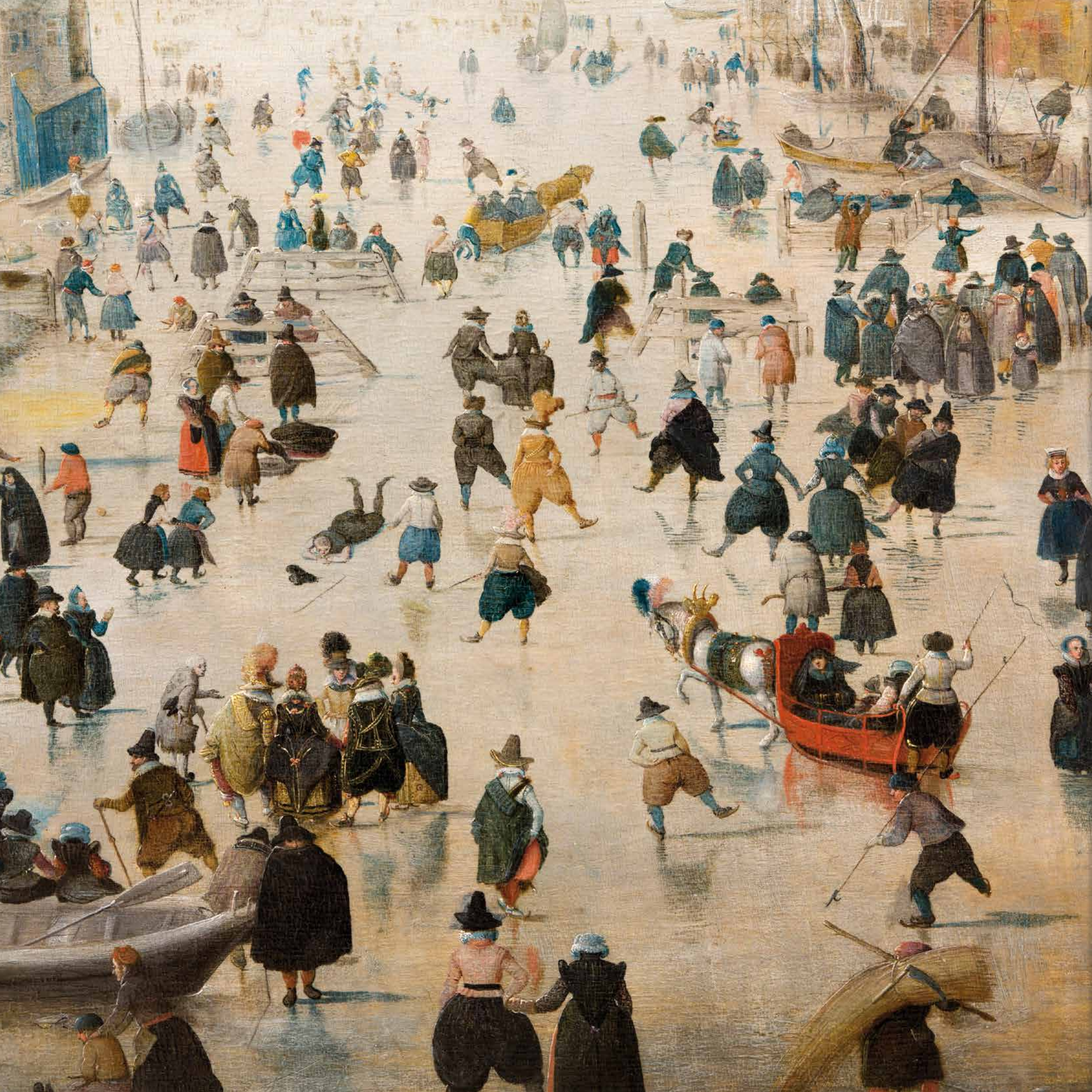
Detail van het schilderij Winterlandschap met schaatsers van Hendrick Avercamp, ca. 1608, in het Rijksmuseum in Amsterdam.