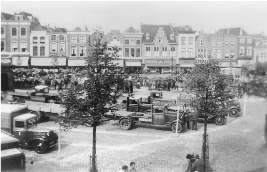
Vordering van paarden en motorvoertuigen op de Goudse Markt tijdens de mobilisatie, 29 augustus 1939.