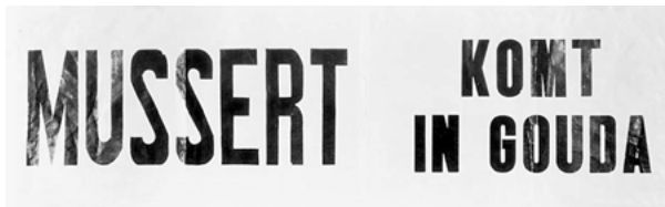
Aankondiging van de komst van Anton Mussert naar Gouda in 1934 voor een spreekbeurt in de schouwburg.

Dinsdag 16 oktober 1934 was een belangrijke dag voor de Goudse NSB. De leider van de Nationaal-Socialistische Beweging, ir. A.A. Mussert, was zelf naar Gouda gekomen en hield een toespraak in de Schouwburg. De volgende dag meldde de pers hierover: