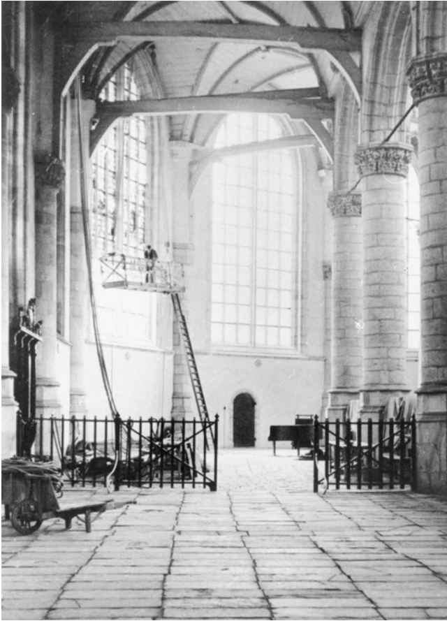
Het uitnemen van de Goudse Glazen van de Sint-Janskerk in de periode september tot december 1939, om ze te beschermen tegen mogelijke oorlogsschade. De kleurrijke glazen werden vervangen door blank glas.