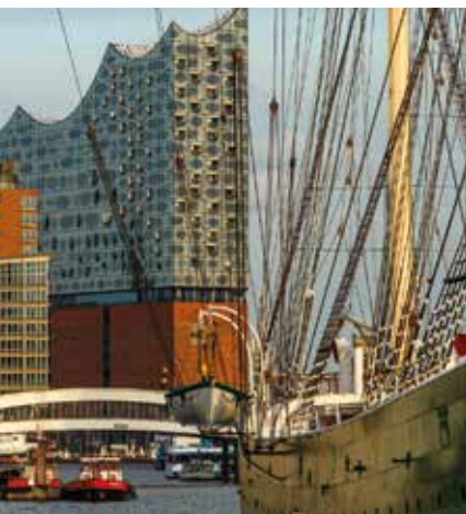
A. Spani/hemis.fr/2022, Herzog & de Meuron Basel