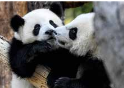
De panda's Pit en Paule in de dierentuin van Berlijn

► De verovering van de ruimte in Jena. Het Zeiss-Planetarium heeft een aangepast programma voor kinderen: ze kunnen zelf de sterren observeren en de basisbeginselen van de kosmos leren. En het museum heeft nog een bijzondere ervaring in petto voor jong én oud: de projectie van de Melkweg over de hele oppervlakte