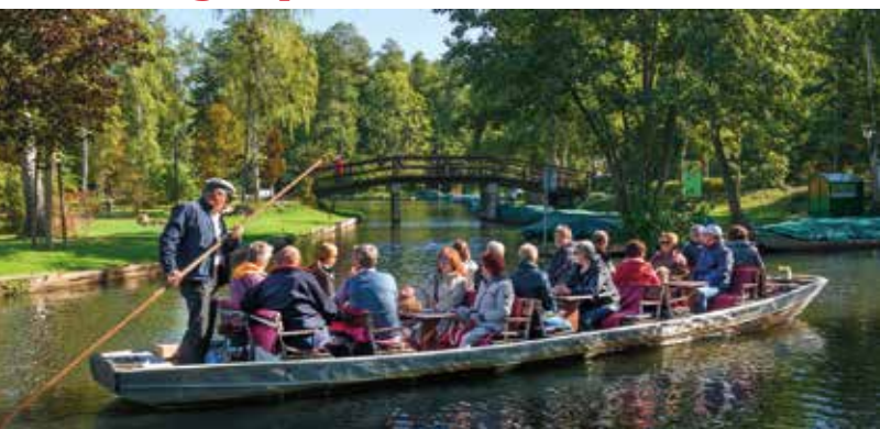
Maak eens een vaartochtje door het Spreewald.

♥ Zwerf over de kanalen van het Spreewald. De specialiteit van dit 'Groene Venetië' is de Kahnfahrt , ontspannen varen aan boord van een platte schuit. De veerman manoeuvreert, dus je hoeft zelf niets te doen, alleen te genieten! Zie blz. 184.