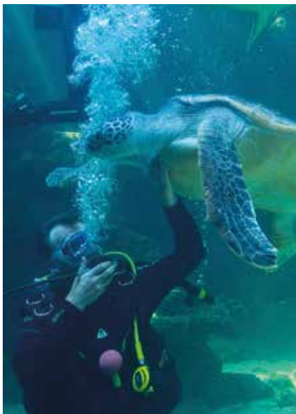
In het Ozeaneum in Stralsund

In Chocoversum leer je hoe cacaobonen worden verwerkt tot chocola en maak je je eigen chocoladereep. Zie blz. 485.