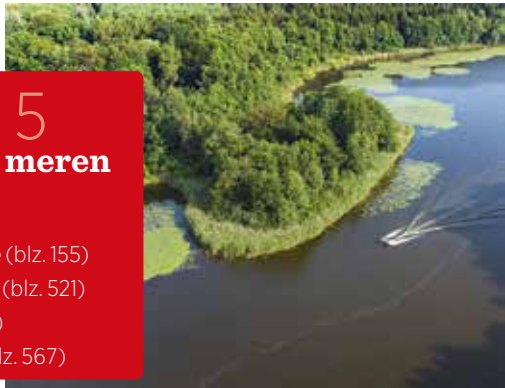
Een van de Mecklenburgse meren

♥ Beluister Brahms en Wagner in de Elbphilharmonie , de transparante concertzaal van Hamburg en de thuisbasis van het NDR Elbphilharmonie Orchester. De architectuur is fascinerend, de akoestiek weergaloos! Zie blz. 486.