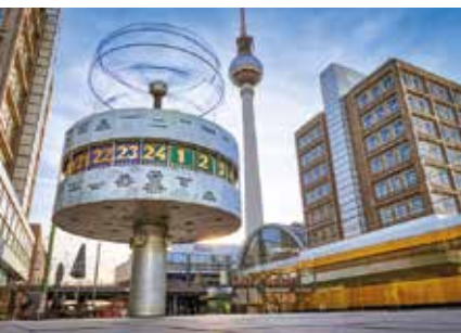
Het Urania Weltzeituhr van E. John en de Fernsehturm van H. Henselmann