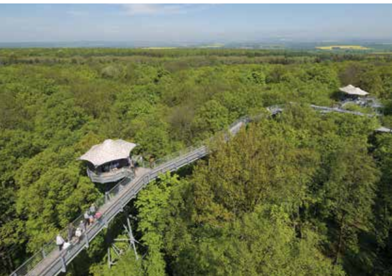
Het Baumkronenpfad in het Thüringer Wald

♥ Snuif in het Thüringer Wald de frisse boslucht op en ga lekker wandelen, bijvoorbeeld op de Rennsteig of de Großer Inselsberg. Op het Baumkronenpfad kun je de boomkruinen zelfs van boven bekijken! Zie blz. 305.