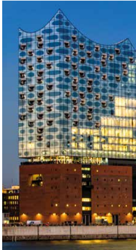
De Elbphilharmonie in Hamburg, ontworpen door Herzog & de Meuron ThomasFluegge/Getty Images Plus/2022, Herzog & de Meuron

♥ Geniet van het goede leven in een bio-dorp. Uitslapen in een zacht bed, een broodje van versgemalen meel eten of ontspannen in de sauna na een wandeling in het bos: in Schmilka ademt alles natuur en rust. En wanneer Petr Scarborough Fair zingt, wordt het ontbijt aan de oevers van de Elbe bijna subliem. Zie blz. 214.