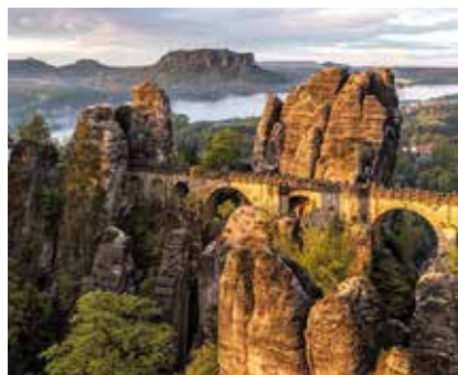
Bastien Schneider/Getty Images Plus