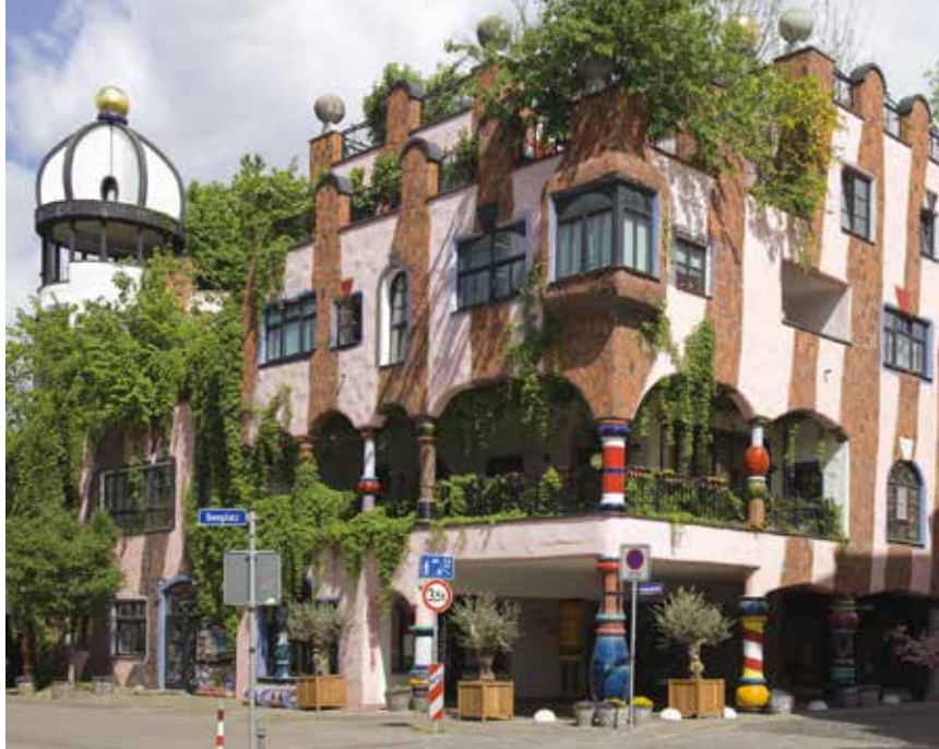
De Grüne Zitadelle (vanuit het zuidoosten), ontworpen door Friedensreich Hundertwasser