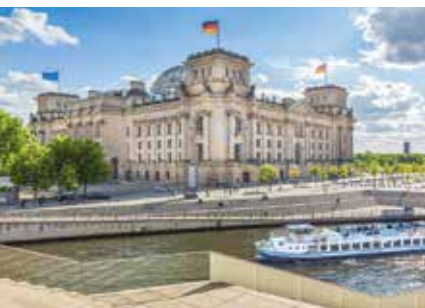
De Reichstag, verbouwd door Foster + Partners