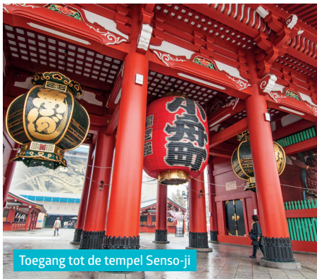
Toegang tot de tempel Senso-ji