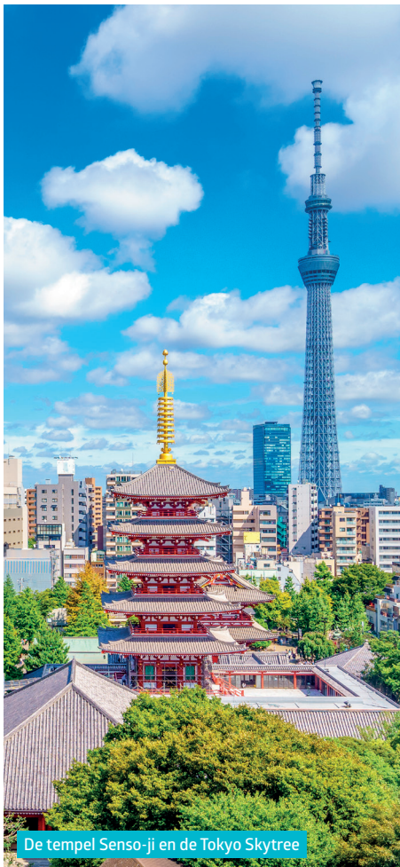
De tempel Senso-ji en de Tokyo Skytree

De 'elektronicawijk' is een paradijs voor fans van de Japanse popcultuur , gamers, geeks en andere otaku , de obsessieve fans van videospellen, manga's en anime. De neonlampen van de elektronica- en computerwinkels flikkeren en op de achtergrond weerklinkt een kakofonie van jingles.