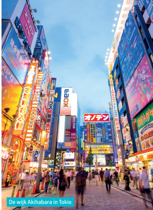
De wijk Akihabara in Tokio