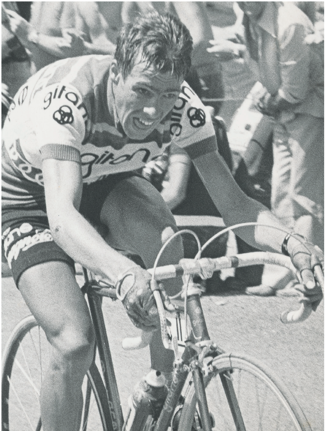
Het is 10 juli 1976. Lucien Van Impe heeft een afspraak met de geschiedenis.