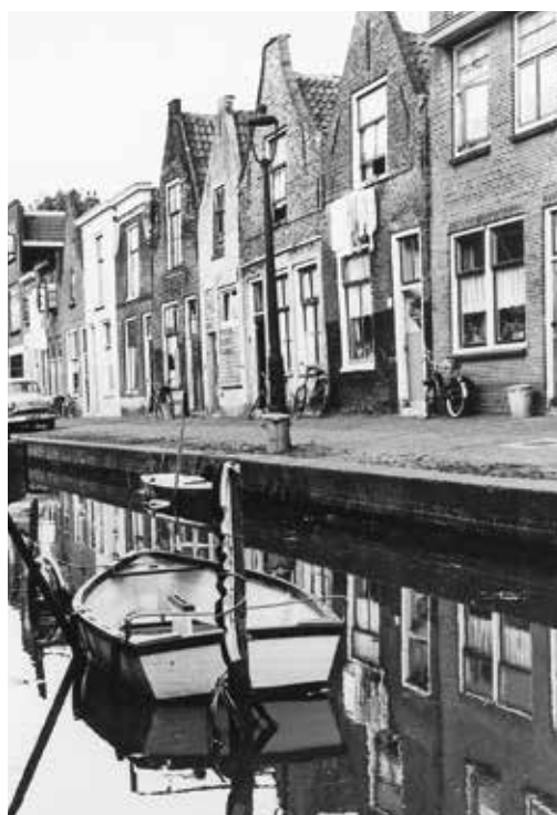
3. (boven) Uiterstegracht, 1958.

De textiel was in Leiden de allesoverheersende bedrijfstak die eeuwenlang het wel en wee van de inwoners bepaalde. In de gedu-