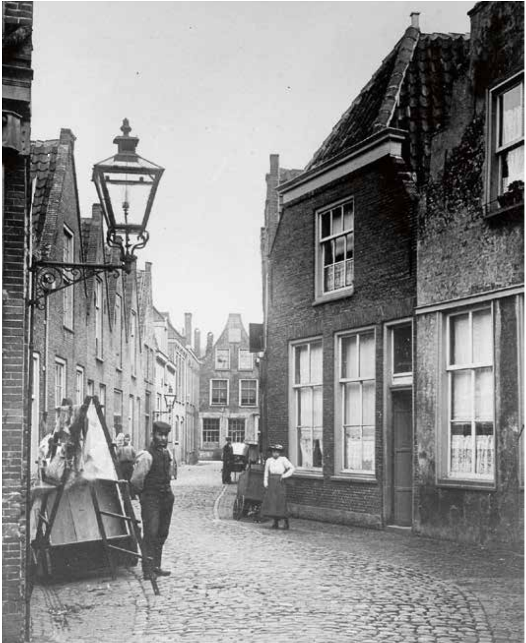
14. Spilsteeg, omstreeks 1900.

Door de eeuwen heen is er in de stad veel gesloopt, verbouwd en herbouwd. Zoals overal waren het vooral de kleinste huizen die daarbij in de vuurlijn lagen, en dus ook de voor Leiden zo karakteristieke 'wevershuisjes'. Hoe dit proces verliep en wat voor gevolgen dit had voor bewoners en huiseigenaren beschrijven de volgende hoofdstukken.