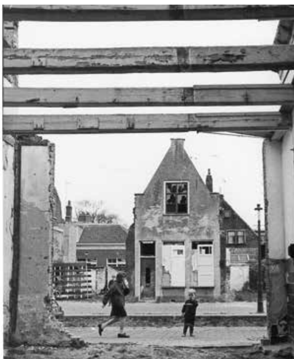
1. Waardgracht, 1966.

Honderd jaar geleden betekende het kraantje op kniehoogte direct achter de voordeur een revolutionaire verbetering van het comfort, in vergelijking met de buurtpomp waaruit slechts door veenmodder gefilterd grachtwater naar boven kwam. Het afvalwater liep toen nog via een halfopen goot naar de dichtstbijzijnde gracht. Inmiddels is elke woning van een heel buizen- en leidingstelsel voorzien. Op zolder, waar ooit de kinderen op een strozak lagen, terwijl regenwater en smeltende sneeuw tussen de pannen door naar binnen dropen, is het dak nu degelijk