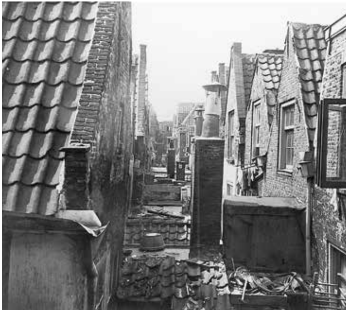
8. (boven) De achtergevels van de Havenstraat en de Binnenvestgracht, 1940.