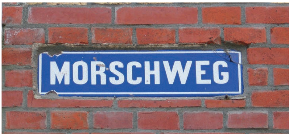
2. Een oud bordje aan de Morsweg in de spelling van voor 1947. Foto Bert de Jonge, 2019.

voor de Straatnamen, die in 1954 door B en W was ingesteld. Deze commissie bestaat nu dus 65 jaar. Het is de aanleiding voor deze publicatie.