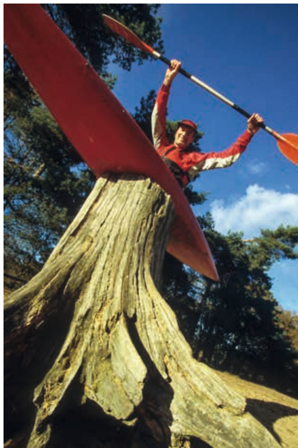
▲ Boomstam met kano op het Lutterzand, de Dinkel, Overijssel

De kano van de inheemse Canadese bevolking werd vooral gebruikt op de rivieren en meren in de Canadese wildernis. Door zijn grote breedte en stabiliteit leende hij zich uitstekend voor het transport van grote lasten, zoals de hele familie met bezittingen of de jachtbuit. Deze kano die we naar hun herkomst ook wel Canadese kano of kortweg Canadees zijn gaan noemen, wordt voortbewogen door een of twee vaarders met een enkelbladige steekpeddel. Ook de Canadese kano werd gebouwd uit het materiaal dat in de natuur voorhanden was. De bootshuid bestond uit grote stukken berkenbast die over een frame van half rond gebogen houten spanten werd gespannen. Hierdoor ontstond een boot die van boven open was, waardoor grote hoeveelheden materiaal eenvoudig in- en uitgeladen konden worden. Door deze open bovenzijde, in tegenstelling tot het gesloten dek van de kajak, wordt dit type boot ook wel aangeduid als open kano. In latere tijden werd het gebruik van de Canadese kano