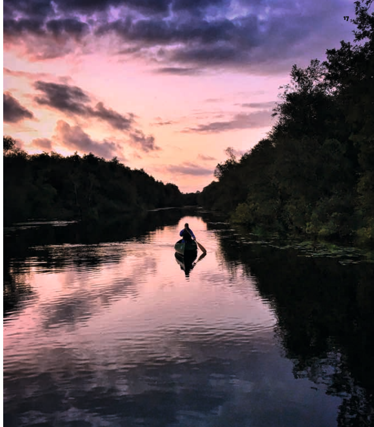
▲ Hemelse lucht boven De Weerribben.

Maar voor een goed begrip van het kanoparadijs moeten we verder kijken dan ieders persoonlijke voorkeur. Al die afzonderlijke vaarwateren hebben met elkaar gemeen dat daar genoten wordt, oprecht en intens. Omdat genieten een bewuste en actieve handeling is – je doet het of je doet het niet – heeft het paradijs dus alles te maken met bewust handelen. ‘Paradijs’ lijkt een zelfstandig naamwoord, maar is eigenlijk een werkwoord!