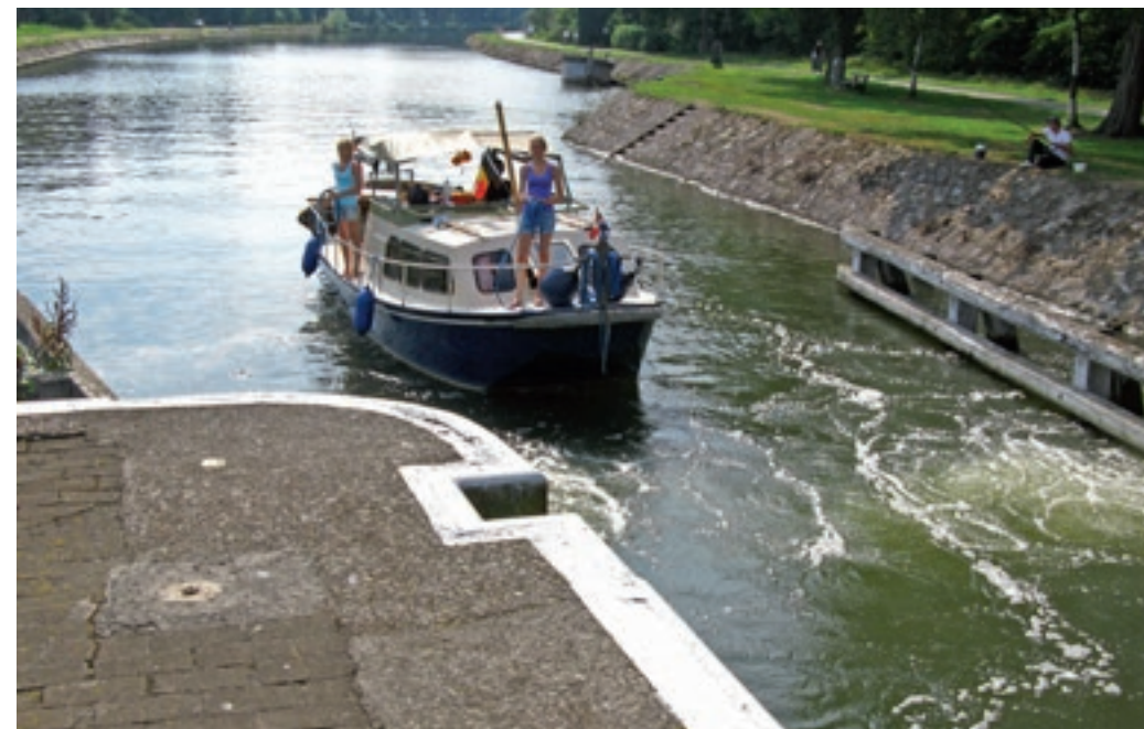
Op veel Belgische kanalen vaar je van sluis naar sluis.

veelvuldig met beroepsvaart te maken krijgt, relatief gezien meer dan in Nederland, waar veel grote watersportgebieden nagenoeg vrij zijn van vrachvaart. Daarom vind je in deel I ook tips over hoe je het beste om kunt gaan met de beroepsvaart en tips om zo soepel mogelijk door de sluisen te komen. Ook zaken als welke boeken en kaarten je nodig hebt komen hier aan bod.