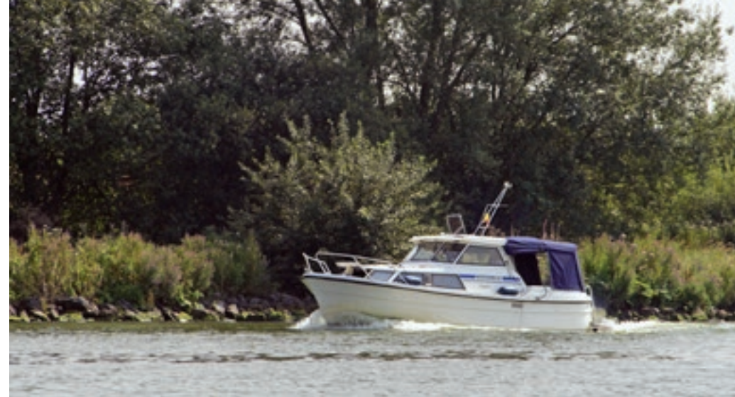
De Schelde-Rijnverbinding heeft mooie groene oevers.

De invaart van de Schelde-Rijnverbinding vanaf het Volkerak wordt aangegeven met geleidelichten. Het verdient aanbeveling om al tijdens de aanloop van het kanaal uiterst rechts ten opzichte van de geleidelichten te varen, zodat je al op het Volkerak buiten de baan van de grote vrachtschepen blijft. Hoewel het kanaal minimaal 120 meter breed is komen de vrachtschepen vaak vrij dicht langsvaren, omdat oplopers en tegemoetkomend verkeer dat noodzakelijk maken. Reden om ook op het kanaal dicht onder de stuurboordwal te blijven. Houd er hierbij rekening mee dat de bakens vaak door onder water liggende strekdammen met elkaar verbonden zijn. De oevers zijn over het algemeen mooi begroeid maar omdat er weinig afwisseling is, maakt het kanaal over het geheel toch een wat saaie indruk. Tijdens de vaart over de Schelde-Rijnverbinding moet je rekening houden met flinke golfslag van de intensieve beroepsvaart. Ter hoogte van Tholen is er wat meer variatie op de oevers te zien en ter hoogte van Bergen op Zoom varieert de breedte van het vaarwater, omdat je daar het Zoommeer oversteekt. Vanaf het Zoommeer is de haven van Bergen op Zoom bereikbaar