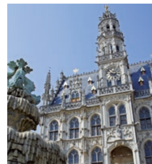
Het stadhuis van Oudenaarde.

Tussen Gent en Oudenaarde is het landschap vlak, vanaf Oudenaarde komen er heuvels in de verte: de Vlaamse Ardennen. De omgeving tussen Oudenaarde en Doornik (Tournai)