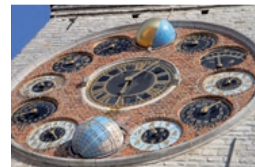
De Jubelklok in de Lierse Zimmertoren.

Vanaf sluis Duffel bevaar je het Netekanaal. Door het ontbreken van het getij en door het feit dat dit kanaal duidelijk aangelegd is, heeft dit deel van de vaarverbinding een totaal ander karakter. Wat blijft is het groen op de oevers, evenals het slechts spaarzaam