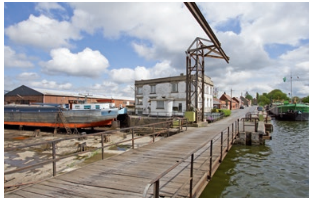
Dankzij de ligging aan de kruising van het Kanaal Nimy-Blaton-Péronnes en de Schelde was Péronnes een centrum van scheepsbouw. Nu is er alleen nog een reparatiewerf met een droogdok.

Voor de 19de eeuw ging alle scheepvaart in deze regio over het riviertje de Hene (Haine). Toen het belang van de steenkolenindustrie in de Borinage (de mijnstreek rond Bergen) steeds belangrijker werd, besloot Napoleon – die het toen voor het zeggen had in deze streken – om het Kanaal Mons-Condé (aan de Boven-Schelde) aan te leggen. Tegen de tijd dat het kanaal werd geopend (in 1818) had Napoleon zijn Waterloo al gevonden en zat hij in ballingschap. Inmiddels zwaaide koning Willem I de scepter over wat nu Nederland en België is, en dus ook over de streek rond Bergen. Omdat een deel van dit kanaal door Frankrijk liep, moest er een hoge tol aan de Fransen betaald worden. Daarom besloot Willem I een nieuw kanaal naar Péronnes te laten graven, een stuk noordelijker aan de Schelde, maar wel op Belgisch grondgebied. Het kanaal naar het Franse Condé liet men voor wat het was. Men begon in 1823 met het werk en in 1826 kon het toen nieuwe Kanaal van Pommerœul naar Péronnes geopend worden. Samen met het in 1919 gereedgekomen Centrumkanaal was dit kanaal een onderdeel van de belangrijke verbinding tussen Schelde en Maas. In 1963 werd besloten het Kanaal van Pommerœul naar Péronnes toegankelijk te maken voor schepen tot 1350 ton. Hiertoe werd het meest westelijke gedeelte verbreed en voor een deel verlegd.