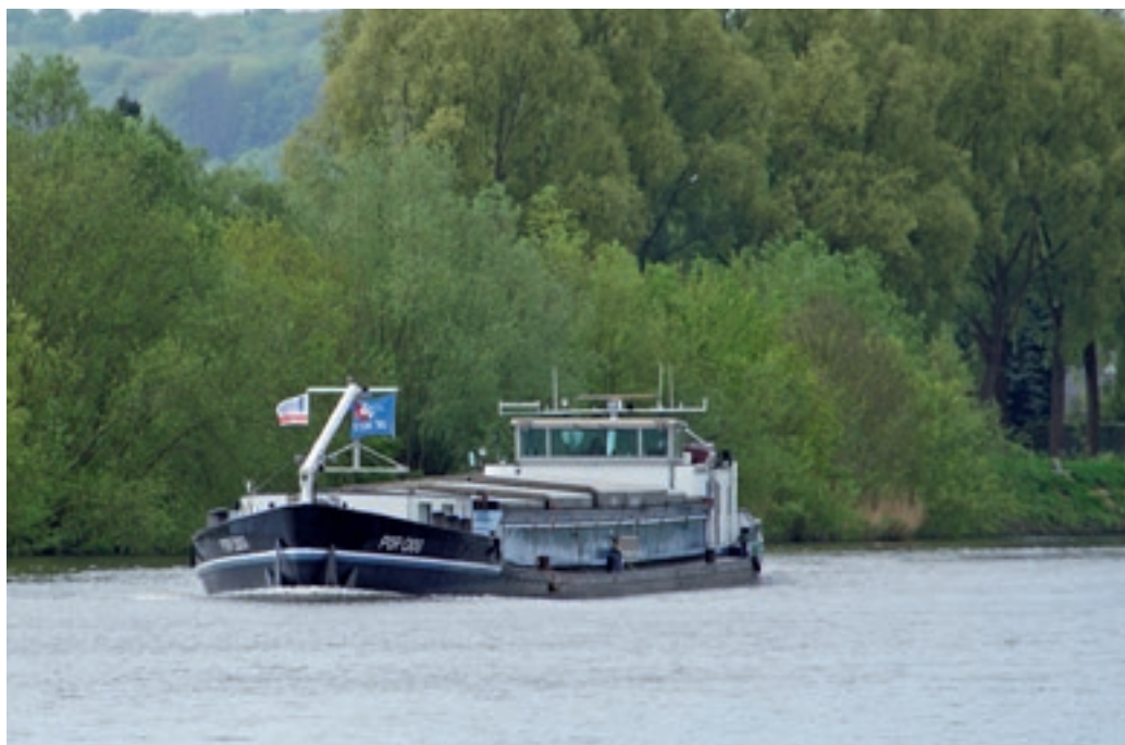
De beroepsvaart maakt intensief gebruik van de Boven-Schelde.

zon- en feestdagen: het gehele jaar 9.00-18.00 uur