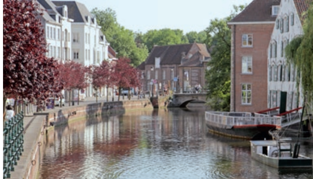
Dwars door Lier lopen diverse grachten.

Het zuidelijkste deel van de Nete, tussen sluis Duffel en de samenvloeiing met de Dijle en de Rupel, is getijdenwater. Dit deel wordt Beneden-Nete genoemd. Vanaf sluis Duffel tot aan de monding in het Albertkanaal ligt het Netekanaal. Het Netekanaal maakt gebruik van de vallei van het riviertje de Nete. De vaarroute (geschikt voor schepen tot 1350