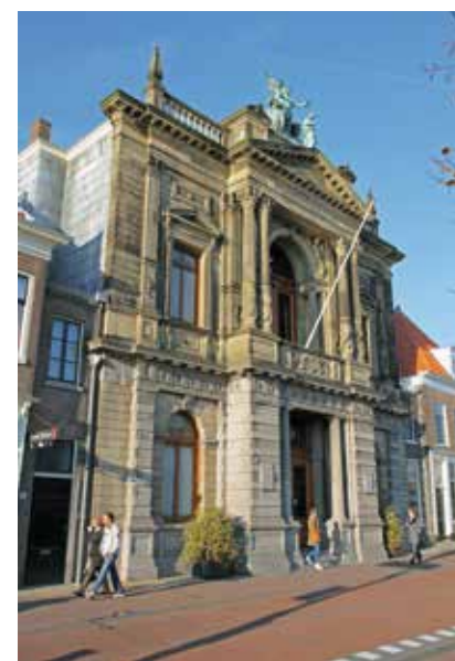
De indrukwekkende voorgevel van Teylers Museum staat op de kade van het Spaarne.

De vaarweg tussen de Ringvaart van het Haarlemmermeer en het Noordzeekanaal wordt gevormd door het Zuider Buiten Spaarne, het Binnen Spaarne, het Noorder Buiten Spaarne en Zijkanaal C. Het Zuider en Noorder Spaarne doen aan als vrij brede, langgerekte meren, maar het Binnen Spaarne is behoorlijk smal. De doorvaart over het Spaarne, dwars door Haarlem, is bijzonder mooi. Je passeert de prachtigste gebouwen en komt vlak langs onder meer Teylers Museum. Als schipper heb je niet altijd even veel tijd om rond te kijken, omdat er in deze kronkelende