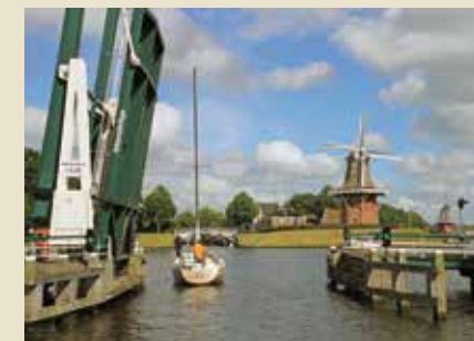
In ons drukbevolkte land moet er wel regelmatig een brug voor je open.

open zijn gegaan – een luttel aantal vaaruren later midden in de natuur te lunchen, hetzij achter je anker; hetzij aan een steigertje voor het riet. Of andersom: na je ontbijtje in een poldersloot gooi je voor en achter los en 's middags lig je midden in een gezellige stad, met je eigen boot als terras, al dan niet achter een glas koele witte wijn. Een ander voordeel van de binnenwateren is dat de oevers vaak heel dichtbij zijn. In plaats van voortdurend bezig te zijn met het afstellen van koers, wind en zeilvoering, kun je veel meer om je heen kijken. Net als je mede-opvarenden... Op de binnenwateren is bovendien heel veel te zien; er gebeurt altijd wel wat: terwijl je over een bochtige, smalle kreek vaart, schiet voor je schip langs de blauw-oranje flits