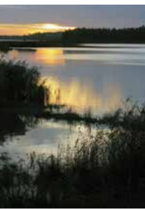
In de Biesbosch is de natuur altijd dichtbij.