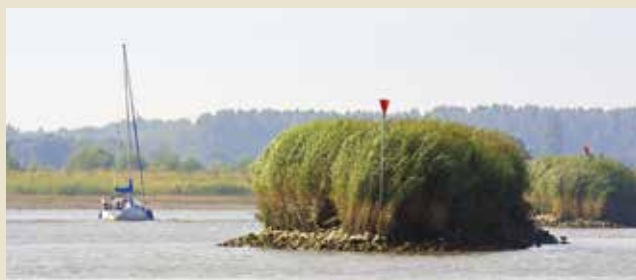
Op de binnenwateren is onderweg vaak veel te zien.