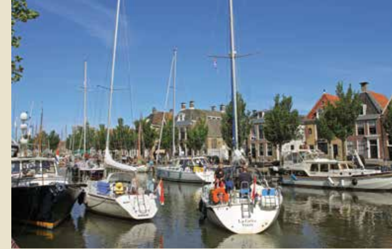
In veel steden kun je met je zeilschip tot in het centrum doorvaren.

Een van de fijnste aspecten van het varen op binnenwateren is de enorme afwisseling die je op een vaardag kunt hebben. Het is in alle delen van het land mogelijk om de dag te starten midden in een grote stad en dan – nadat een paar bruggen voor je