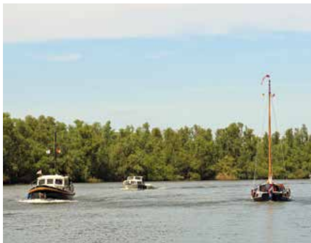
Het Nauw van Paulus is een van de doorgaande routes in de Biesbosch.

De Biesboschsluis ligt bij Werkendam, aan het Steurgat, en de Spieringsluis ligt aan het Gat van de Hardenhoek. In dit meest uitgestrekte deel van de Biesbosch heb je de meeste vaarmogelijkheden en ook de meeste aanlegplaatsen en wandelpaden. Het getij in dit deel van de Biesbosch is een schijngetij – het wordt vooral beïnvloed door de waterstand op de Amer en het spuiprogramma van de Haringvlietsluizen.