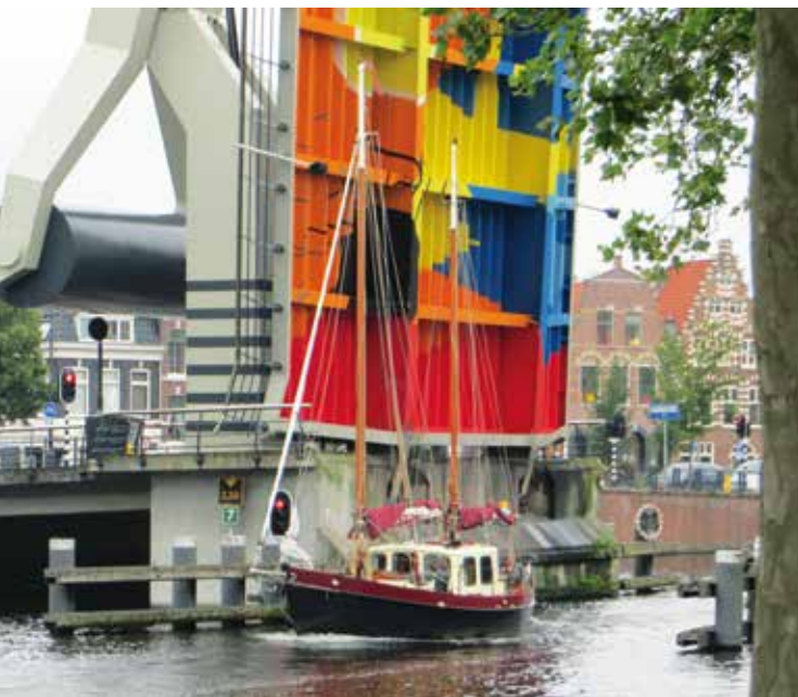
De Langebrug in Haarlem heeft een onverwacht vrolijke onderkant.