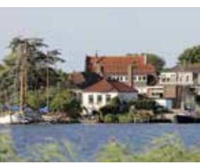
Het oude gedeelte van Spaarndam is langs een smalle dijk gebouwd.