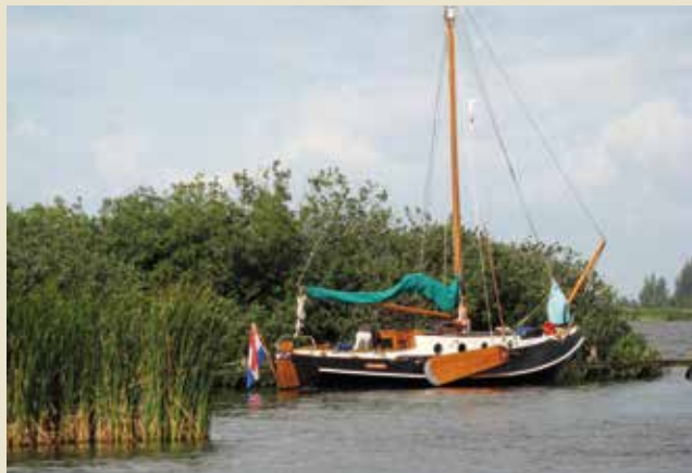
Ook in de drukste watersportgebieden zijn nog rustige oppertjes te vinden.

van een ijsvogel naar de overkant. Op een ander moment glijden er weilanden voorbij, waarin Hollandse koeien dromerig staan te herkauwen. En aan het eind van de vaardag word je vanaf een vol terras bekeken, of je ziet, genoeglijk in de kuip van je eigen schip, een stad met oude gevels op de kades vanaf 'de andere kant' – een ervaring waarvoor toeristen in de rondvaartboot moeten stappen. Wel is het natuurlijk zo dat je met een zeiljacht meestal wat meer gebonden bent aan de doorgaande vaarwegen, domweg omdat daar de grootste vaardiepte te vinden is en daarover de meeste beweegbare bruggen liggen. Ook brengen doorgaande routes over het algemeen meer drukte met zich mee. Maar toch kun je vaak, door net even een afslag te nemen, de rust opzoeken van een stil oppertje of een rustige ankerplek. En wie denkt dat je alleen maar op de motor kunt varen op de binnenwateren, zal zijn mening moeten bijstellen: op verrassend veel binnenwateren is het mogelijk om de zeilen te hijsen en de motor uit te zetten, uiteraard wel afhankelijk van windrichting en ligging van het vaarwater: