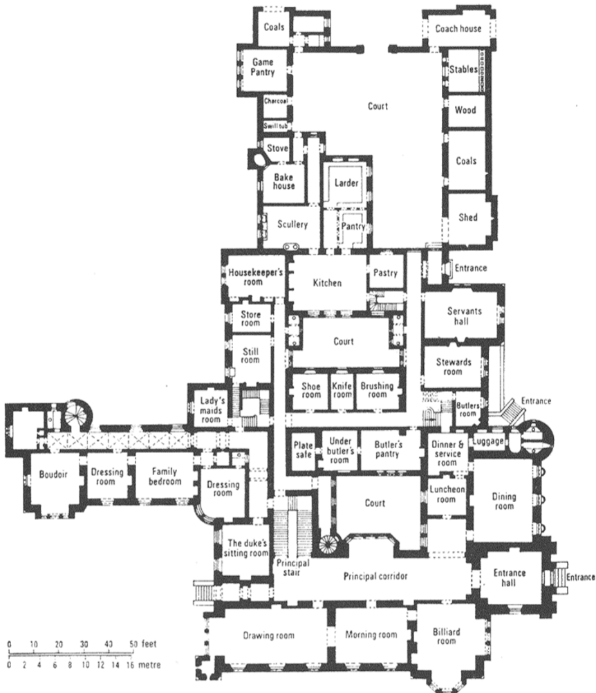
Figuur 2a Bestaande plattegrond.