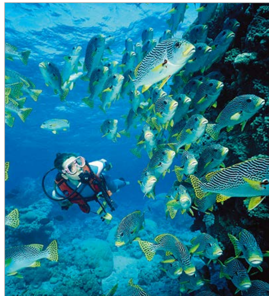
Duiken bij Cairns.

De diversiteit aan planten is ongelooflijk groot. Net als de dierenwereld heeft ook de Australische flora te lijden van geïntroduceerde soorten, die de oorspronkelijke begroeiing verdringen en het ecologisch evenwicht bedreigen. Dankzij het herplanten van inheemse bomen in sommige steden is het vogel- en insectenleven er teruggekeerd. □