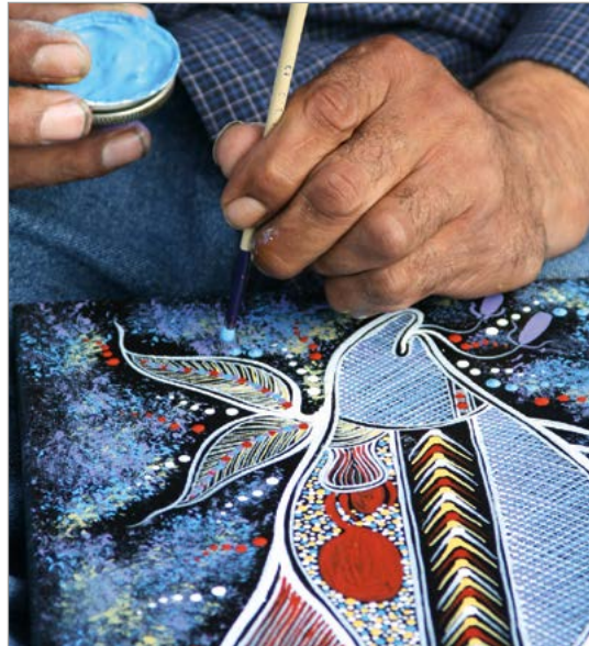
De vervaardiging van Aboriginal-kunstsijverheid.

Volgens de algemene opvatting kwam het ongenoegen onder de Aboriginals pas in de jaren zestig en zeventig aan de oppervlakte, maar in feite bestond in 1924 in Sydney al een beweging ter bevordering van de rechten van de Aboriginals. De in Melbourne gevestigde Australian Aborigines Advancement League diende in 1932 een petitie in bij de Britse koning om speciale verkiezingen voor de inheemse bevolking te eisen. Als koloniale Australiërs (en dat waren er veel) geloofden dat Aboriginals hen dankbaar moesten zijn voor