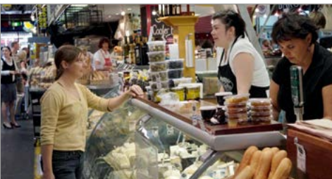
De befaamde overdekte markt van Adelaide.

Perfect voor zeebanket. Met visafslag, marktstalletjes, restaurants en zelfs een kookschool. Zie blz. 113.