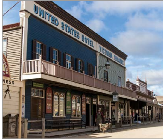
Sovereign Hill is een openluchtmuseum in Golden Point, een buitenwijk van Ballarat, Victoria.