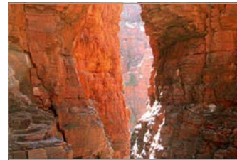
Weano Gorge in het Karijini National Park, Western Australia.

Tegenwoordig vinden veel Australiërs het overigens helemaal geen probleem dat hun land zo ver van Europa en de Verenigde Staten ligt en zijn ze blij met de relatieve nabijheid van Azië. En de natuur mag er dan van tijd tot tijd problemen veroorzaken, tegelijkertijd vormt ze een bron van eindeloze fascinatie, met verschijnselen als buideldieren, eierleggende zoogdieren, onherbergzame, barre woestijnen - en ja, ook giftige spinnen en dodelijke slangen. □