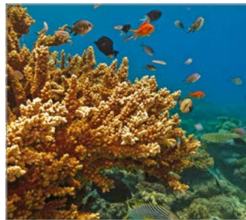
Het Great Barrier Reef.

Wie Sydney bezoekt, mag ook de Blue Mountains en de afgelegen oude mijnplaats Broken Hill eigenlijk niet missen. Als u naar Melbourne reist, vergeet dan niet de bergen in te gaan en een rit over de Great Ocean Road te maken. Brisbane is niet compleet zonder een bezoek aan het Great Barrier Reef, de eilanden en het tropische regenwoud bij Daintree. Vanuit Canberra kunt u de Snowy Mountains bezoeken, en in Adelaide kunt u van de gelegenheid gebruikmaken om het bekende wijngebied de Barossa Valley en de ondergrondse woningen van Coober Pedy, midden in de woestijn, te zien. Ten noorden van Perth ligt de Kimberley en ten zuiden de eeuwenoude bossen en wijnhuizen van Margaret River. Vanuit Hobart kunt u naar het schitterende Freycinet National Park, Cradle Mountain of het Port Arthur Penal Settlement reizen. Darwin is de toegangspoort tot Kakadu, met zijn rijke Aboriginalcultuur, tropische wetlands en zoutwaterkrokodillen. En wie echt wil beleven hoe bijzonder dit oude land is, zou hoe dan ook een bezoek moeten brengen aan Uluru, midden in het continent. □