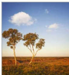
Het weidse landschap van Australië.

Een gedetailleerde gids van het hele land, waarbij de belangrijkste bestemmingen met een cijfer (of letter) zijn aangegeven op de kaartjes (bijvoorbeeld ❶).