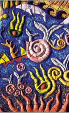
Mozaïek in Melbourne.

Aboriginal-schilderingen in Kakadu, NT. Ver in het noorden, op de wanden van Nourlangie en Ubirr Rock, zijn de oudste schilderijen van