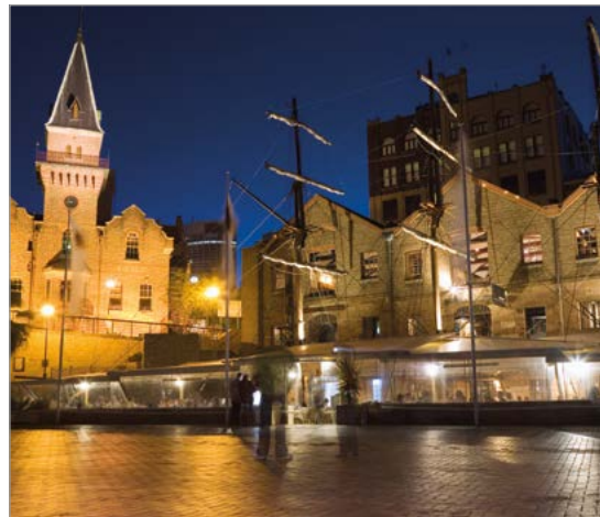
Campbell's Cove in The Rocks, Sydney.

Charters Towers, Qld. Aantrekkelijk goudzoekersstadje met fraaie koloniale panden. Zie blz. 221.