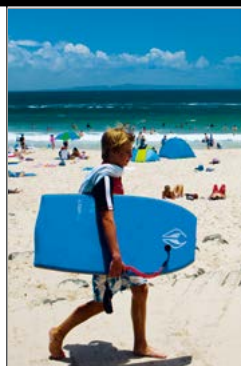
Noosa Beach, Queensland.

Dit werelderfgoed heeft een rijk onderwaterleven. Voer de dolfijnen bij Monkey Mia. Zie blz. 283.