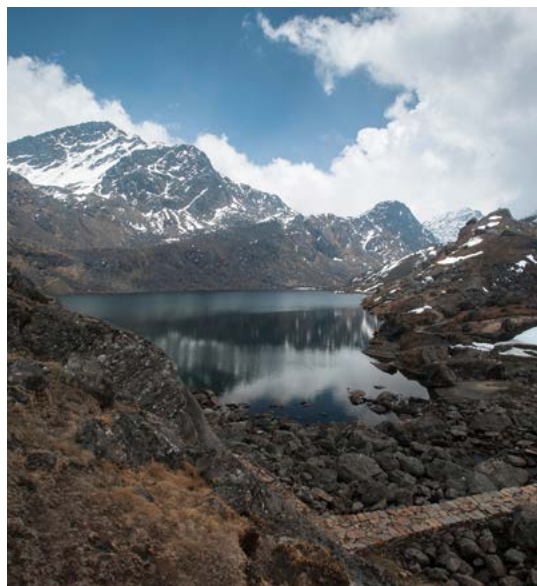
Een van de meren van Gosainkund.

De theorie van de platentektoniek en continentendrift is aan het begin van de 20e eeuw gefor-