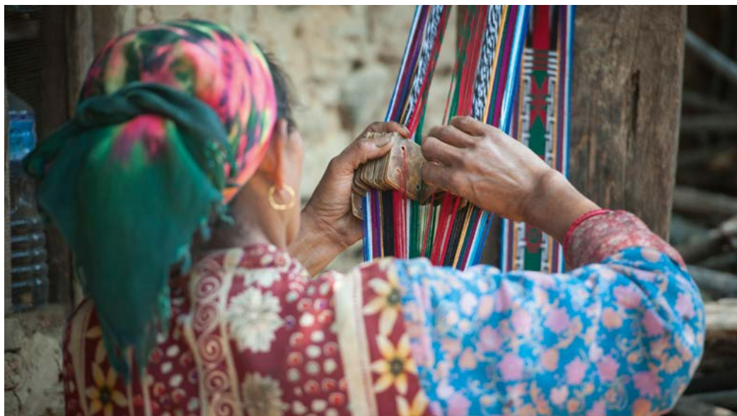
Weven is nog steeds een belangrijk ambacht.

Ongeglazuurd rood aardewerk van klei uit de Vallei van Kathmandu is overal te koop. De lokale kumals (pottenbakkers) maken praktische producten voor allerlei doeleinden, bijvoorbeeld het bewaren van yoghurt. De ongeglazuurde pot zuigt de overtollige vloeistof op, waardoor de yoghurt extra dik en romig wordt. Grappige variaties zijn de grote en kleine bloempotten in de vorm van neushoorns, olifanten en griffioenen.