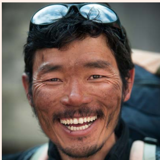
Een goedlachse Sherpa.

centrale plek in: veel trekking-organisaties hebben er hun hoofdkwartier en huren er hun crews. Veel Sherpa's zijn er, al dan niet permanent, gaan wonen. Sommige families hebben zoveel verdiend met het toerisme dat ze een dure opleiding kunnen bekostigen voor hun kinderen, die zo het dorpsleven met zijn traditionele verwachtingen ontstijgen. Voor veel jonge Sherpa's is Kathmandu niet genoeg: ze trekken naar de VS, Japan, India of het Midden-Oosten.