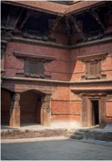
Lohan Chowk in Bhaktapur.

Een gedetailleerde gids van het hele land, waarbij de belangrijkste bestemmingen met een cijfer (of letter) zijn aangegeven op de kaartjes (bijvoorbeeld 1 ).