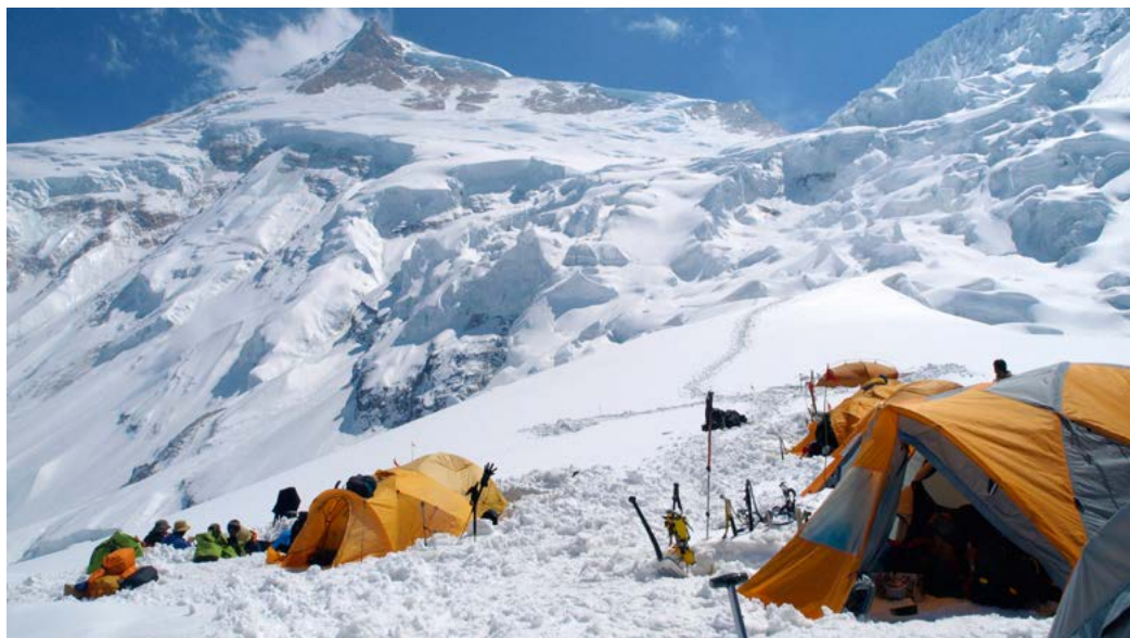
Kamp 1 op 6100 m op de Manaslu.

Hoewel er vóór 1953 geen serieuze pogingen werden gedaan de berg te bedwingen, had de Zwitsers-Amerikaanse alpinist Norman Dyhrenfurth wel al een route naar de top vastgesteld vanaf de Zuidcol van de Everest. Europese en Amerikaanse expedities hadden geen succes, maar in het voorjaar van 1956 vestigde een Zwit-