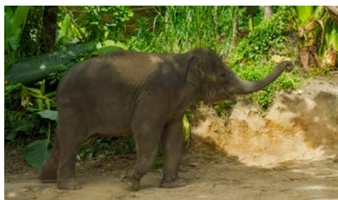
Olifantenjong in de Terai.

Shey-Phoksundo. Dit uitgestrekte berggebied is de habitat van blauwschape, wolven en de majestueuze sneeuwluipaard. Zie blz. 306.