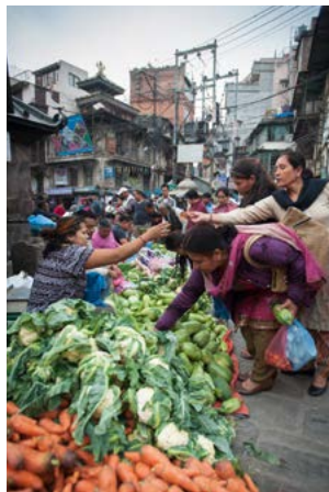
Op de markt.

het midden van het gehemelte, in plaats van tegen de tanden. e = ee als in 'nee' u = oe als in 'toen' y = yi als in het Engelse 'yield' i = i als in 'tin' o = oo als in 'toon' Nepalezen begroeten elkaar meestal niet met 'goedemorgen', 'goedemiddag' of 'goedenavond'. In plaats daarvan kunt u bij het groeten het beste uw handen tegen elkaar voor uw borst houden, uw hoofd licht buigen en 'namaste' (naa-mas-stee) zeggen. Met dit eenvoudige zinnetje kunt u een glimlach en een warme groet terug verwachten.