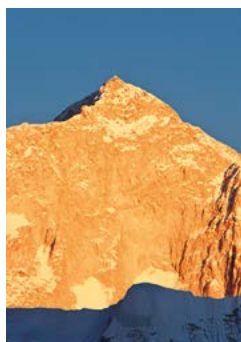
De Makalu is de op vier na hoogste berg ter wereld.

Vanuit Hille voert het pad noordoostwaarts omhoog door dorpen van migranten uit de Walungchung-regio, die vroeger jaldrijvers waren op de oude handelsroutes. De tweede overnachting is bij het Gupha Pokhari (3150 m), een meer op een kam die uitziet op het Kanchenjunga-massief in het oosten en de Makalu en Khumbu Himal in het westen. Vanhieruit voert een korter pad over de Milke Danda (4700 m) naar de Jaljale Himal , een afgelegen merengebied met Tibetaanse bergvolken. De route over de Milke Danda is rotsachtig en vaak nevelig; onderweg is weinig water te vinden. Met een lokaal bekende gids kunt u op de terugweg oostwaarts afdalen naar de Mewa Khola (Papajarivier) en het vliegveldje