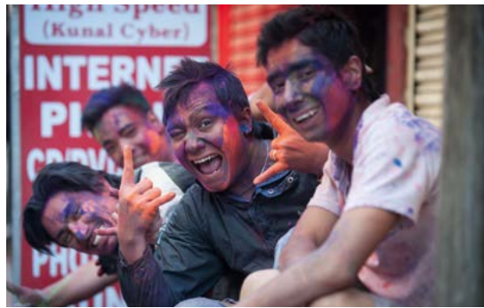
Feestvierders tijdens Holi in Kathmandu.