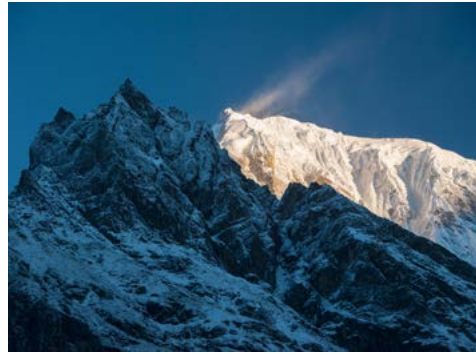
Een adembenemend berglandschap.

In het noorden wacht onvermijdelijk het hooggebergte. De meeste bezoekers gaan naar het Annapurna-gebied, dat al decennialang goede mogelijkheden biedt voor korte en lange voettochten; naar de Everest-regio, het klimgebied bij uitstek; of naar de regio Langtang-Gosainkund-Helambu direct ten noorden van Kathmandu. Avontuurlijke reizigers kunnen daarnaast hun hart ophalen in de uitgestrekte wildernis van verafgelegen, minder vaak bezochte streken zoals Manaslu, Kanchenjunga en Mustang.