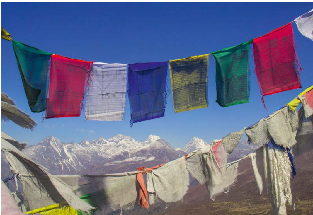
De hoogste bergen ter wereld worden omlijst door gebedsvlaggen.