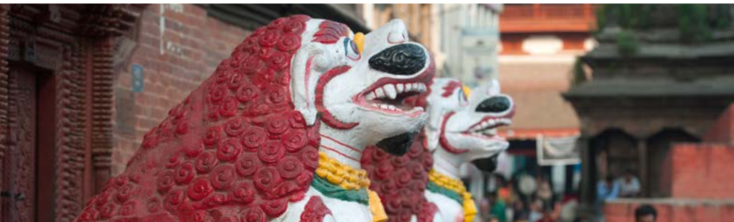
Leeuwen voor de Kumari Bahal op Durbar Square.