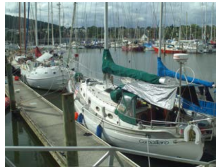
De jachthaven van Whangarei.

Het vruchtbare Taranaki en Manawatu zijn landbouw- en veeteeltgebieden bij uitstek. Wellington, dat op het zuidelijkste puntje van het eiland ligt en een mooie haven heeft, is de hoofdstad van Nieuw-Zeeland. In deze bruisende stad zijn de hoofdkantoren van enkele van de grootste bedrijven van het land gevestigd.