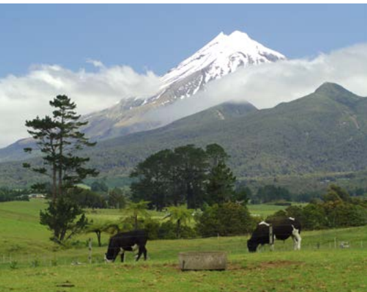
Mount Taranaki vanaf Cannington Road, New Plymouth.