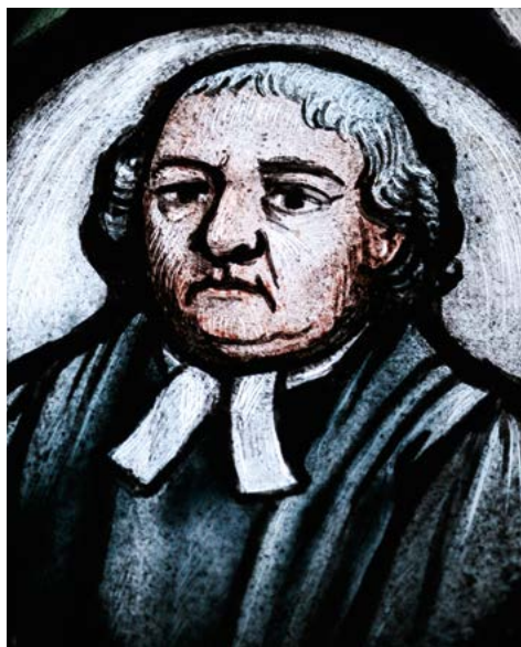
Samuel Marsden introduceerde naar verluidt het christendom in Nieuw-Zeeland.

Ondanks dit alles was er sprake van een vreedzame, bloeiende ruilhandel: de Maori's ruilden