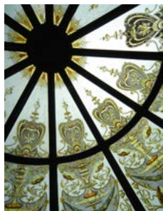
Koepel van een paviljoen in de tuin bij Larnach Castle.

Het natuurschoon op het Zuidereiland is ongeëvenaard, met reusachtige bergketens, ongerepte stranden, indrukwekkende fjorden en maagdelijk regenwoud.