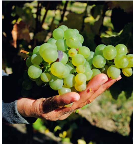
Sappige druiven in een wijngaard bij Renwick.

De meest karakteristieke wijn van Nieuw-Zeeland, sauvignon blanc, wordt in dit land vaker - en met meer succes - dan waar ook ter wereld ge-