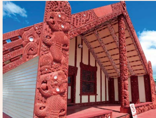
Ontmoetingshuizen (whare runanga) zijn van oudsher centra van het sociale, culturele en spirituele leven.