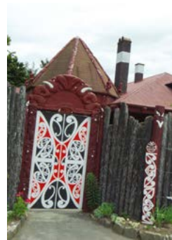
Maori-houtsnijkunst in de Turangawaewae Marae. Het complex is alleen bij speciale gelegenheden geopend voor het publiek.

Cambridge is het centrum van de paardenfokkerij. Op mozaïektegels in het centrum zijn legendarische paarden als Zabeel, sir Tristram en Empire Rose afgebeeld, evenals plaatselijke winnaars van goud bij de Olympische Spelen, zoals wielrenster Sarah Ulmer en de roeisters Georgina en Caroline Evers-Swindell. De Cambridge Raceway ( www.cambridgeraceway.co.nz ) is een van de belangrijkste renbanen van het land. In Cambridge is ook de grootste in paarden gespecialiseerde dierenartsenpraktijk van Nieuw-Zeeland gevestigd, Cambridge Equine Hospital.