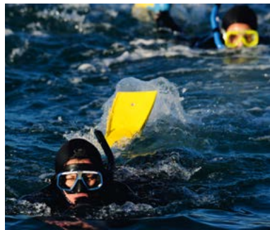
Zwemmen met dolfinen.

Stewart Island is in de Maori-mythologie het anker van de boot van Maui. Ook de meeste Nieuw-Zeelanders zijn nooit op Stewart Island geweest, het op twee na grootste eiland, maar op veel bezoekers die de moeite wel hebben genomen, heeft het een onuitwisbare indruk gemaakt.