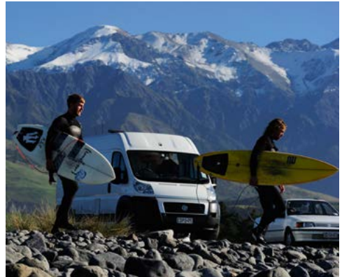
Surfers bij het ochtendkrieken, Kaikoura.

New Regent Street, Christchurch. De eerste volledig gerenoveerde straat van Christchurch na de verwoestende aardbeving van 2011. Een van de mooiste straten van het land, met fraaie voorbeelden van architectuur in Spanish Mission-stijl. Zie blz. 248.