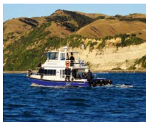
Dolfijnen observeren, Kaikoura.

Wie een bezoek brengt aan Nieuw-Zeeland, het land van de Maori's, zal van de ene verbazing in de andere vallen. Er zijn weinig landen met zoveel natuurschoon in zo'n relatief klein gebied.