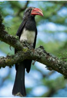
Kuiftok op de hellingen van Mount Kenya.

yuki ligt. Onder het beschermde gebied vallen het oorspronkelijke Sweetwaters Game Reserve , dat in 1988 als neushoornreservaat werd opgezet, en de rest van de ranch, die iets later is aangekocht door de Britse natuurorganisatie Fauna and Flora International. De verscheidenheid aan wild is bijzonder groot: met slechts één overnachting maakt u al goede kans leeuwen, olifanten, Kaapse buffels en zwarte en witte neushoorns te zien. Verder leven er netgiraffen, beisa's, Thomson- en Grantgazelles (de laatste met een ongewoon donker uiterlijk) en lelwels, een ondersoort van het hartebeest. Ook beide Keniaanse zebrasoorten komen voor in Ol Pejeta; voor zover bekend is dit de enige plek waar ze regelmatig onderling paren.