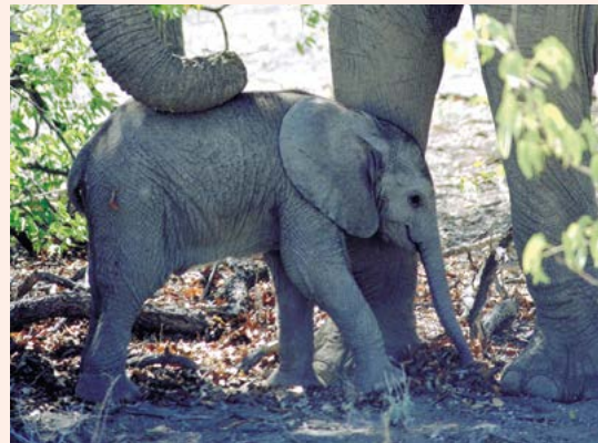
De hele kudde zorgt voor de kalfjes.

Jonge bullen worden uit de familiegroep verdreven als ze te onstuimig worden en zoeken elkaar op in losse vrijgezellenkudden van zo'n 20 dieren, die