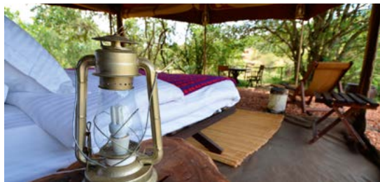
Tentenkamp in de Masai Mara.

Rekeru Camp. Dit stijlvolle, luxeueze kamp bevindt zich op een perfecte locatie voor het observeren van wild in de centrale Masai Mara. De ruime tenten kijken uit op de rivier de Talek. Zie blz. 172. Satao Camp. Dit prachtig gelegen tentenkamp in Tsavo East, dat door veel expats wordt bezocht, kijkt uit op een waterpoel die geregeld honderden olifanten tegelijk trekt. Zie blz. 240.