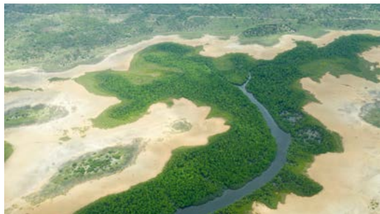
De Lamu-archipel vanuit de lucht gezien.

Fort Jesus. Dit imposante 16e-eeuwse bolwerk in Mombasa was drie eeuwen lang het belangrijkste strategische bouwwerk aan de Oost-Afrikaanse kust. Het is nu een museum. Zie blz. 248 en 249.