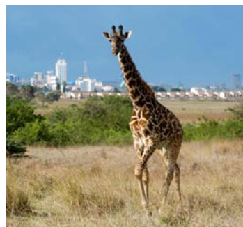
Masaigiraf, Nairobi National Park.

Verder naar het noorden wacht de spectaculaire verlatenheid van het Turkana-meer, in het verre zuidwesten het dichtbevolkte bekken waarin het Victoriameer ligt, het op één na grootste zoetwatermeer ter wereld. Tot slot biedt Kenia nog een 480 km lange kust met eeuwenoude Swahilihavens als Mombasa, Malindi en Lamu, mooie stranden aan de Indische Oceaan en verschillende mariene reservaten waar het schitterend snorkelen en duiken is.