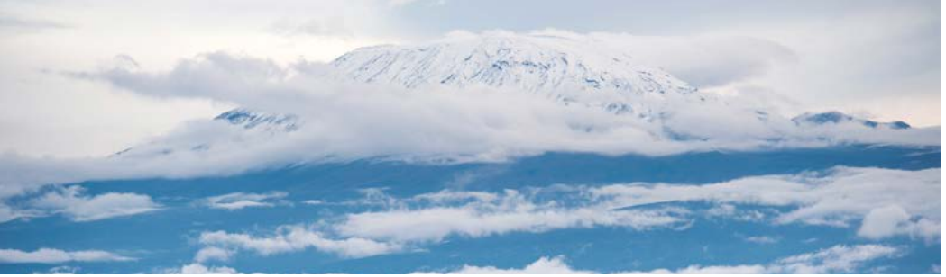
De uitlopers van Mount Kilimanjaro.