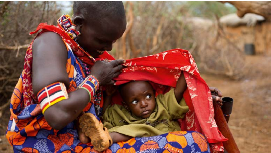
Masaimoeder en kind, Selenkay Conservancy.

De Masai zijn een van de bekendste Oost-Afrikaanse volken. Net als bij de Kalenjin waren de voorouders van dit trotse herdersvolk afkomstig uit de Nilotische taalgroep. Ze trokken tussen de 16e en 18e eeuw vanuit het Nijldal zuidwaarts en