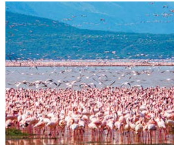
Kleine flamingo's in Lake Bogoria.

Kenia is ook in cultureel opzicht een fascinerend land, waar regelmatig alle clichés over Afrika worden gelogenstraf. Nairobi geldt als een van de grootste, modernste en meest geïndustrialiseerde steden van het continent, maar niet eens zo ver daarbuiten komt u Masai en andere herdersvolken tegen die nog vasthouden aan de waarden en levenswijze van hun voorouders. Ergens tussen deze twee uitersten bewegen zich de Swahili uit de kustgebieden, wier rijke islamitische erfenis, het product van duizend jaar handel met het buitenland, voortleeft in havens als Mombasa, Malindi en Lamu.