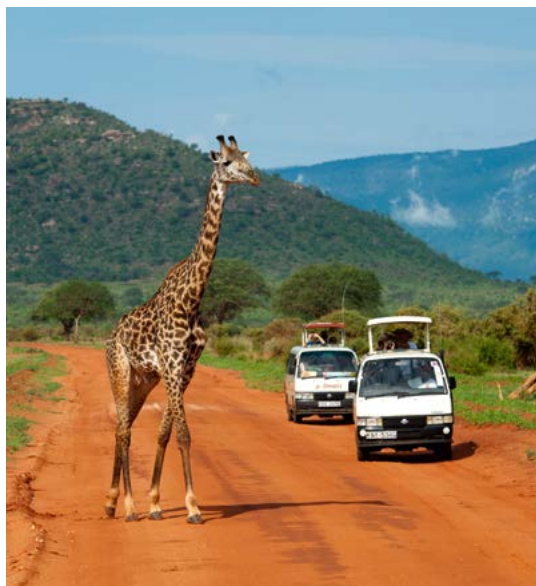
Overstekende Masaigiraf, Tsavo East National Park.

In de jaren zeventig en tachtig voltrokken de meeste safarireizen zich volgens een standaardpatroon. De toeristen werden ondergebracht in grote, op hotels lijkende stenen gebouwen waar de nachtelijke gevaren van de bush veilig op afstand werden gehouden. De activiteiten beperkten zich doorgaans tot ritten bij daglicht in de beter ontsloten delen van een handjevol populaire reservaten en parken. Vanaf de jaren negentig is het aanbod veel diverser geworden. Een opvallende ontwikkeling is dat de grote stenen lodges steeds meer terrein verliezen aan rustieke, maar dikwijls zeer luxeuze tentenkampen. Bovendien worden er buiten de gevestigde nationale parken en reservaten nieuwe initiatieven ontwikkeld door particulieren en lokale gemeenschappen, die naast de gebruikelijke dagexcursies ook nachtritten en wandelsafari's onder leiding van een gids aanbieden. Ook goedkope kampeersafari's of safari's te paard of op een kameel behoren tot de mogelijkheden. Er zijn speciale reizen voor vogelliefhebbers en amateurfotografen en op sommige plekken kunnen op eigen gelegenheid reizende toeristen de bush zelfs te voet verkennen.