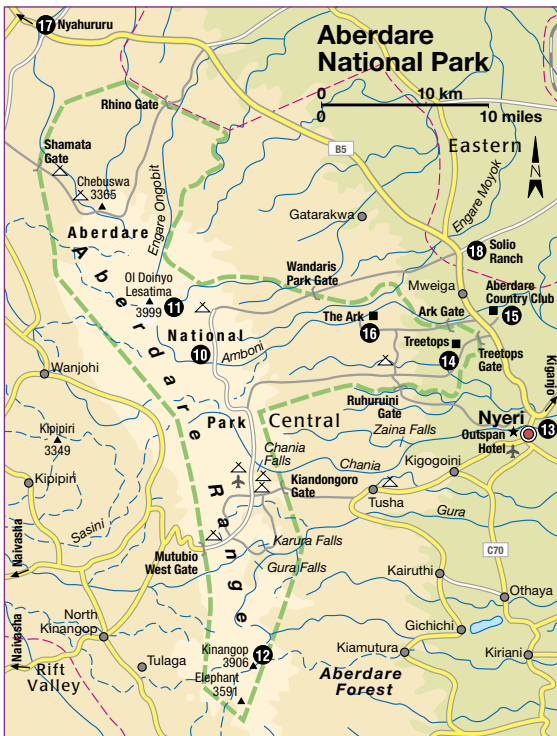
De Karuru Falls.

Aan de hoofdweg van Nanyuki naar Isiolo, circa 3 km na de afslag naar Meru, bevindt zich de toegang tot de Lewa Wildlife Conservancy (www.lewa.org; geen toegang voor dagtoeristen), die in 2013 is opgenomen op de lijst van