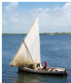
Dhow in de Lamu-archipel.

Een gedetailleerde gids van het hele land, waarbij de belangrijkste bestemmingen met een cijfer of letter zijn aangegeven op de kaartjes (bijvoorbeeld 1 ).