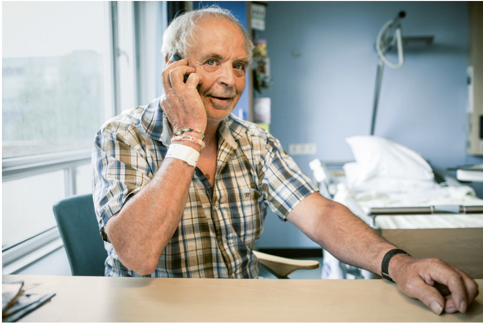
Eerste bezoek als predikant aan een gemeentelid in het ziekenhuis. De broeder op de foto werd met spoed opgenomen in het ziekenhuis. Op de foto belt hij met het thuisfront.