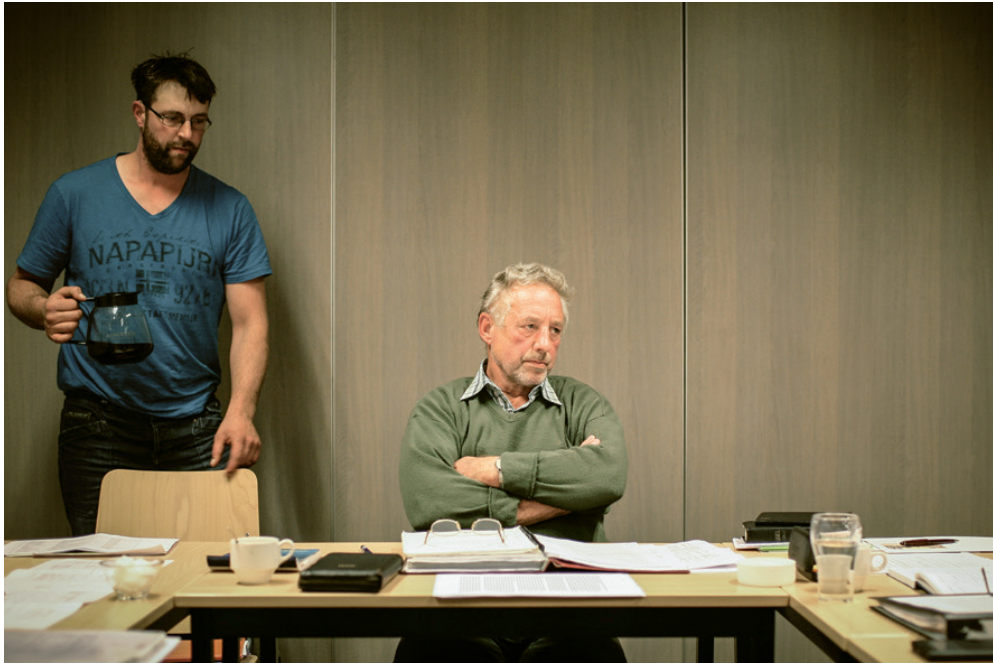
De preses tijdens een kerkenraadsvergadering. Een van de diakenen schenkt koffie in.