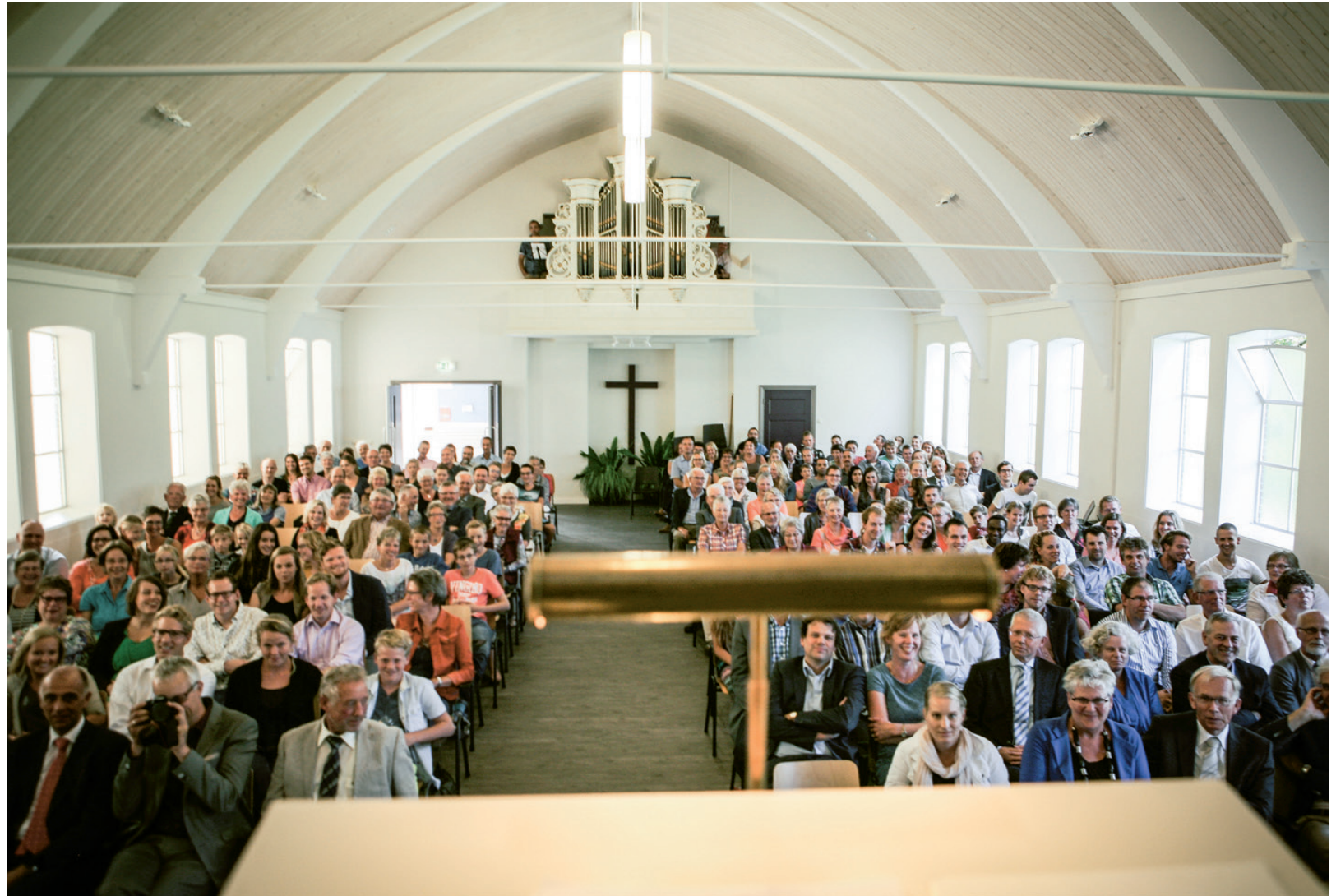
Intrede-dienst op zondag 7 september 2014 in de Gereformeerde Kerk (vrijgemaakt) van Blije-Holwerd.