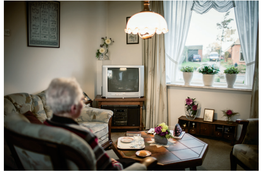
Op bezoek bij een 91-jarige zuster, die nog zelfstandig woont. Ze is al geruime tijd weduwe.