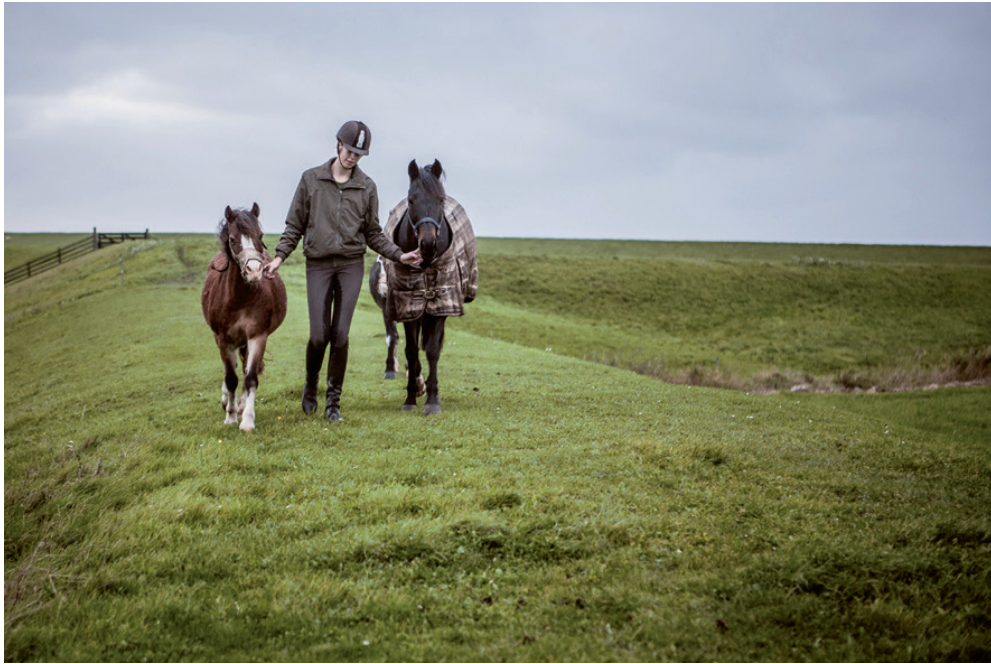
Jonge vrouw, lid van de gemeente, brengt paarden – of pony's – terug van de zeedijk naar de stal.