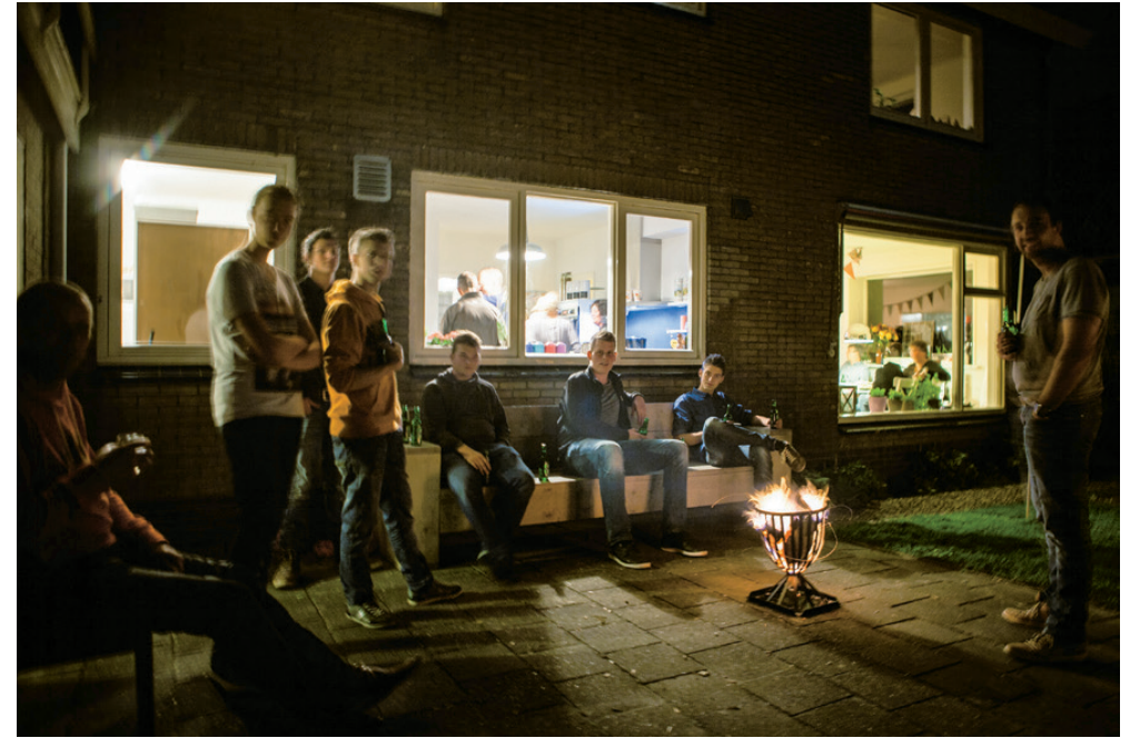
Housewarming voor de gemeente, najaar 2014.