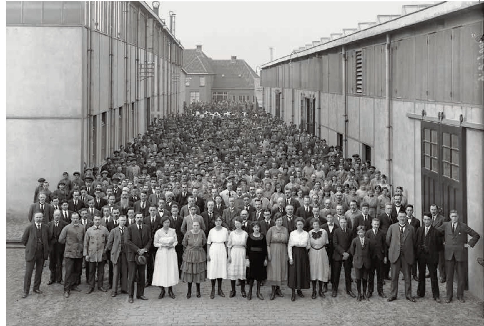
Groepsportret van het personeel van Lips tussen twee loodsen aan de Merwedestraat op De Staart omstreeks 1925.

Lips weet lang een sterke concurrentiepositie te behouden en zelfstandig te blijven. Na eerst een fusie met Gispem N.V. wordt de onderneming uiteindelijk in 1971 overgenomen door het Britse Chubb. In 2007 komt een einde aan Lips in Dordrecht met de verplaatsing van alle bedrijfsactiviteiten naar Diemen, Raamsdonkveer en het buitenland. Van de fabrieksgebouwen is niets meer over.