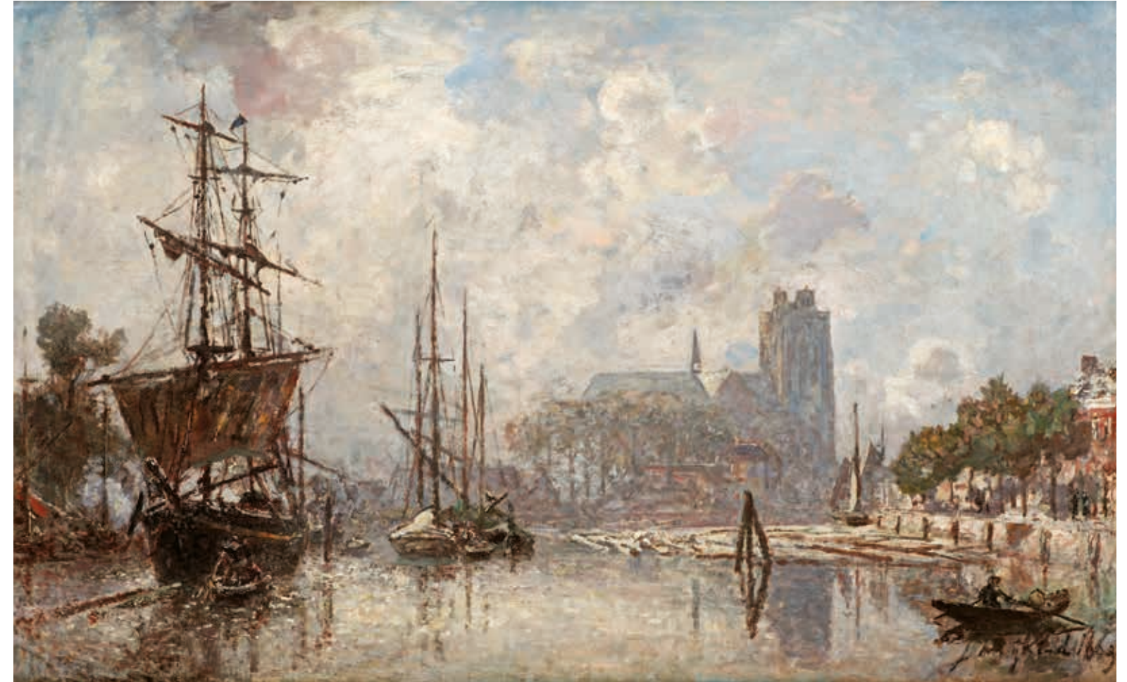
Le port de Dordrecht door Johan Barthold Jongkind uit 1869. Collectie Dordrechts Museum.

Meer nog dan Amsterdam groeit Dordrecht in de loop van de negentiende eeuw uit tot de lievelingsplek van internationale kunstenaars. Een paar honderd schilders bezoeken tussen 1850 en 1920 de stad. Men komt af op het pittoreske karakter van de binnenstad en de ongerepte vergezichten in de regio. Door Jongkinds enthousiasme over Dordrecht in Frankrijk komen ook veel Franse schilders op bezoek. Het inspirerende Hollandse landschap wordt opgezocht, bestudeerd, geschetst en geschilderd.