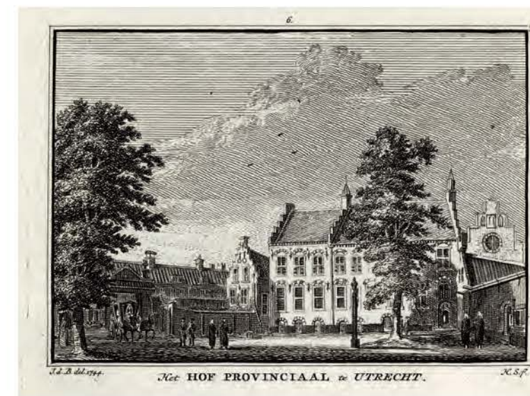
699. Het Hof Provinciaal in Utrecht Hendrik Spilman naar Jan de Beijer, 1744, 71 x 100 mm, VN, VII, nr. 6 → TS, XI, 346

Omstreeks 1581 werd het middeleeuwse minderbroederklooster verbouwd tot zetel van de Staten van Utrecht. De voormalige refter, de Statenkamer, diende tot 1795 als vergaderzaal. De prent toont de voorzijde van het complex vanuit het zuiden. De monumentale hoofdingang met stoep en natuurstenen poort uit 1643 bevond zich in de zuidwesthoek van het Janskerkhof (→ 707). Het plein met lindebomen is rechts te zien.