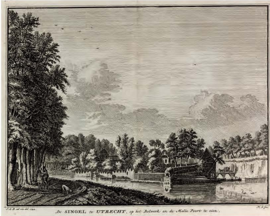
693. De Singel bij bolwerk Lepelenburg in Utrecht Hendrik Spilman naar Jan de Beijer, 1744, 152 x 200 mm, VN, VIII, zonder nummer → TS, XI, 308

Links is de Maliesingel te zien en in het midden het bolwerk Lepelenburg, aan de overzijde van de Stadsbuitengracht. Oorspronkelijk had het bolwerk een militaire functie, maar in de achttiende eeuw stonden er buitenhuisjes en siertuinen met geschoorenen hagen in golvende vormen, waterstoepen, loofgangen en prieeltjes. Rechts is de stadsmuur en de bomerij op de wal weergegeven. Een koets rijdt over de brug van de Maliepoort.