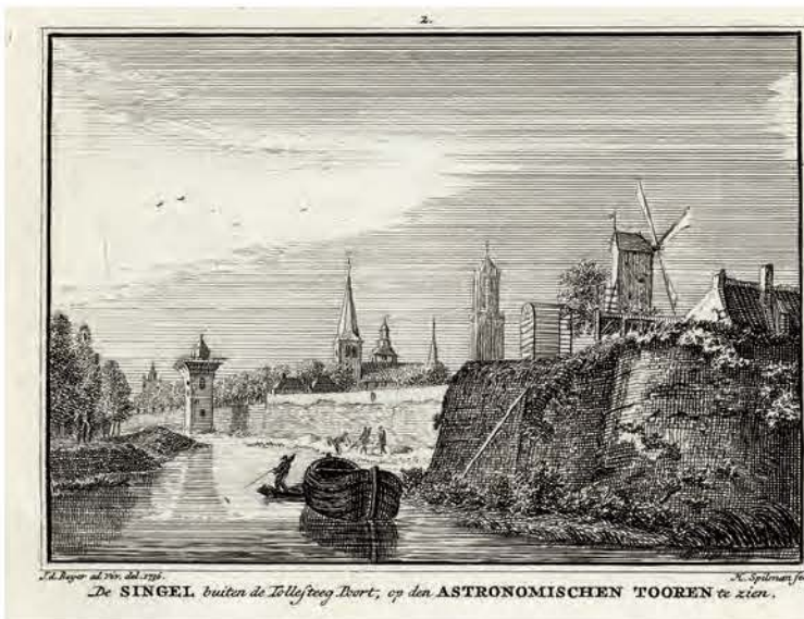
695. De Singel tussen het bastion Sterrenburg en de Smeetoren in Utrecht Hendrik Spilman naar Jan de Beijer, 1736, 71 x 100 mm, VN, VII, nr. 2 → TS, XI, 308

Deze prent laat de Ganzenmarkt in noordwestelijke richting zien met in het midden een schuin aflopend, overkluisd wed naar de Oudegracht. Hierdoor konden goederen die per schip werden aangevoerd, met paarden en karren de stad worden ingebracht. Het hoge hoekhuis links is het huis Keyserrijk, waarvan de begane grond vanaf 1614 als waag fungeerde. Het gekanteelde stadskasteel op de achtergrond in het midden is huis Groot Groenewoude aan de Oudegracht.