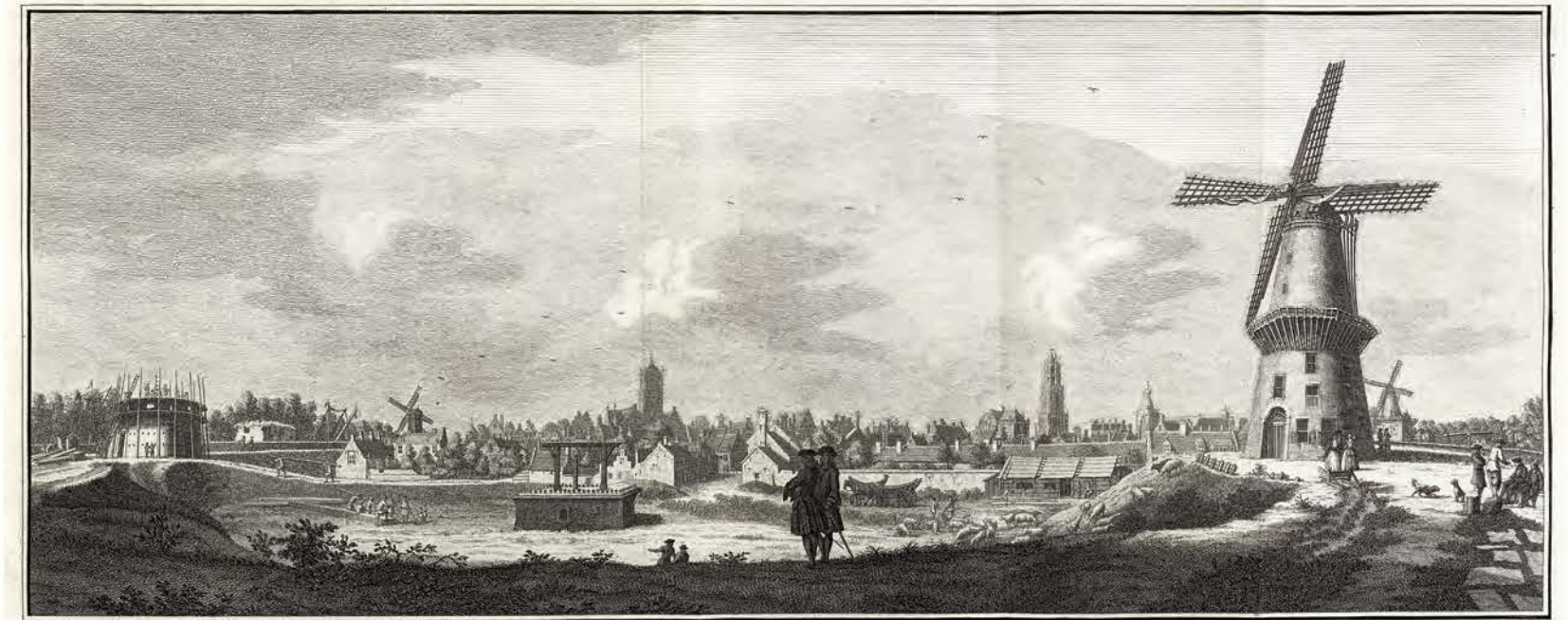
De Stad UTRECHT, van het Paardenveld te zien.