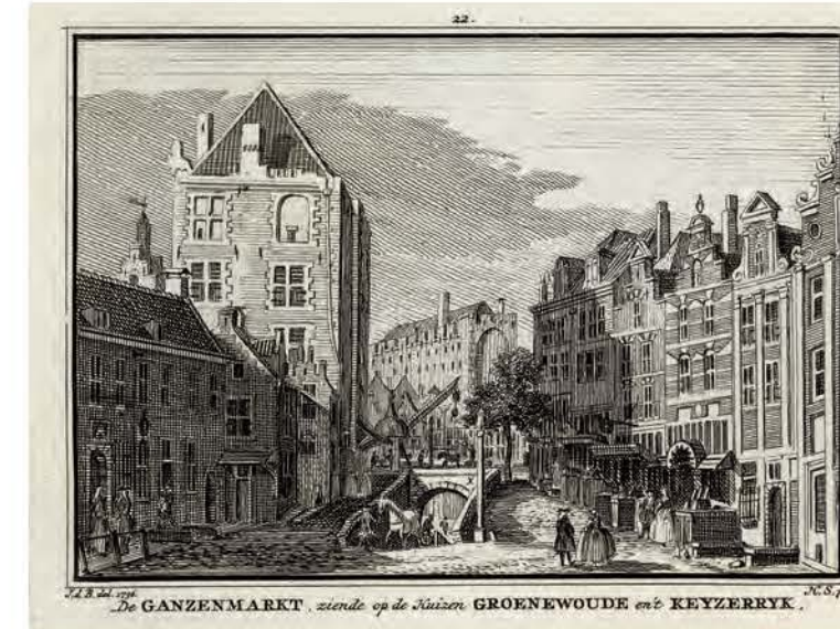
697. De Ganzenmarkt in Utrecht Hendrik Spilman naar Jan de Beijer, 1736, 71 x 100 mm, VN, VII, nr. 22 → TS, XI, 343

Vanaf de Catharijnesingel heeft Jan de Beijer de stadsmuur, de Stadsbuitengracht, de Catharijnepoort en de Catharijnebrug met rechts een accijnshuisje weergegeven (→ 682). Achter het zeventiende-eeuwse poortgebouw is de molen De Fortuin op het noordwestelijk bastion van het voormalig kasteel Vredenburg te zien. Op de achtergrond is de molen op de Bijlhouwerstoren afgebeeld (→ 680). Geheel links steekt de Domtoren (→ 703) hoog boven een waltoren uit.