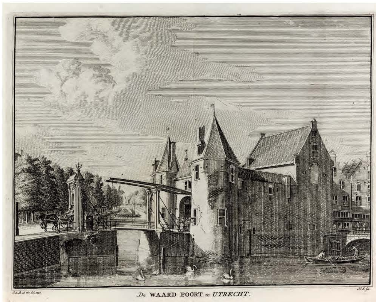
686. De Weerdpoort in Utrecht Hendrik Spilman naar Jan de Beijer, 1736, 152 × 200 mm, VN, VIII, zonder nummer → TS, XI, 308

Dit gezicht vanaf de Singel aan de noordwestzijde van de stad toont de Stadsbuitengracht en de stadsmuur bij de ruineuze waltoren Het Paard, rechts op de prent. Op dit gedeelte van de wal stonden geen bomen. Verderop ligt het bastion Morgenster met de standermolen Klaarwater. Uiterst rechts steekt de toren van de Jacobikerk (→ 711) boven de stadsmuur uit. Op de achtergrond zijn de huizen aan de Bemurde Weerd Oostzijde te zien.