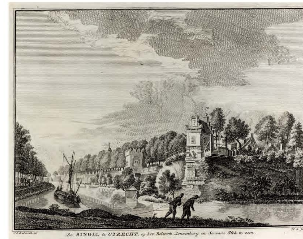
688. De Singel bij bolwerk Zonnenburg en de Servaastoren in Utrecht Hendrik Spilman naar Jan de Beijer, 1746, 152 × 202 mm, VN, VIII, zonder nummer → TS, XI, 308

De Weerdpoort of Amsterdamse Poort lag aan de noordzijde van de stad, op de plek waar de Oudegracht, rechts, en de Stadsbuitengracht, links van de poort, samenkomen. Het middeleeuwse gebouw was in de achttiende eeuw nog in hoofdvorm aanwezig, al waren de kantelen verdwenen. Hier is de stadspoort vanuit het westen in beeld gebracht. Rechts is de Zandbrug te zien met daarachter de gevels van de eerste huizen aan de Oudegracht.