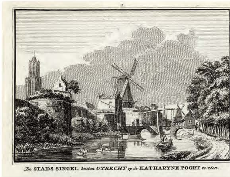
694. De Singel bij de Catharijnepoort in Utrecht Hendrik Spilman naar Jan de Beijer, 1736, 71 x 100 mm, VN, VII, nr. 1 → TS, XI, 308

Jan de Beijer tekende dit uitzicht vlak buiten de stad, bij de Maliebrug. Hij keek in noordoostelijke richting. Links is de Stadsbuitengracht te zien, rechts het begin van de Maliebaan. Tussen de bomerijen bevindt zich het omheinde terrein waar het maliespel werd gespeeld. Links is het Maliehuis (→ 692) afgebeeld, het woonhuis van de maliemeester.