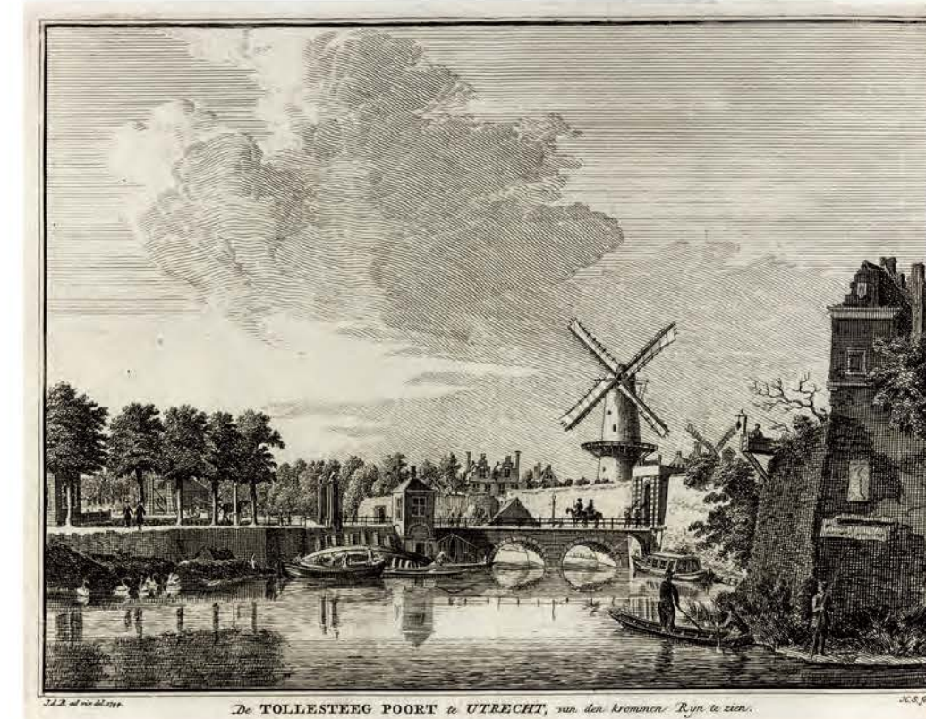
De TOLLESTEEG POORT in UTRECHT, van den Krommen Rijn te zien.

Het Paardenveld was een driehoekig terrein in de noordwestelijke hoek van de stad. In de zestiende eeuw werd er een markt in paarden gehouden. Toen Jan de Beijer het veld in 1745 vanaf de stadswal tekende, was de molen Rijn en Zon, uiterst links op de prent, in aanbouw, terwijl de molen De Meiboom, rechts vooraan, net was voltooid. Op de voorgrond in het midden is een schavot met een galg te zien. Op de achtergrond is het profiel van de stad vanuit het noordwesten weergegeven met in het midden de toren van de Jacobikerk (→ 711) en rechts die van de Dom (→ 703) en de Buurkerk (→ 710).