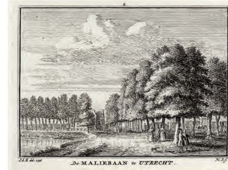
696. De Maliebaan in Utrecht Hendrik Spilman naar Jan de Beijer, 1736, 71 x 100 mm, VN, VII, nr. 8 → TS, XI, 308

Links is de Maliesingel te zien en in het midden het bolwerk Lepelenburg, aan de overzijde van de Stadsbuitengracht. Oorspronkelijk had het bolwerk een militaire functie, maar in de achttiende eeuw stonden er buitenhuisjes en siertuinen met geschoorenen hagen in golvende vormen, waterstoepen, loofgangen en prieeltjes. Rechts is de stadsmuur en de bomerij op de wal weergegeven. Een koets rijdt over de brug van de Maliepoort.