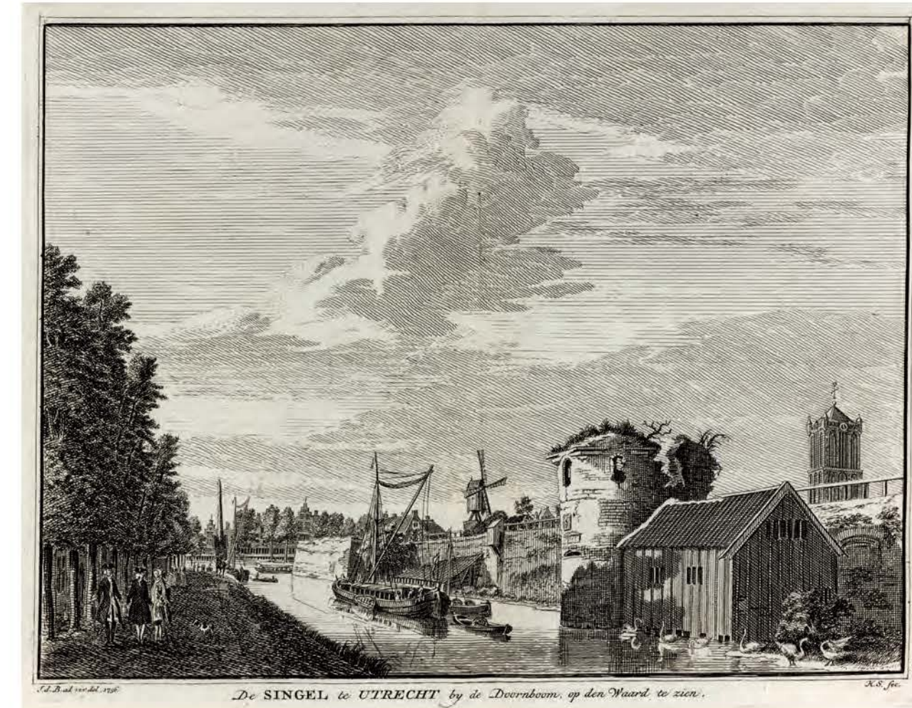
687. De Singel bij de waltoren Het Paard in Utrecht Hendrik Spilman naar Jan de Beijer, 1736, 150 × 198 mm, VN, VIII, zonder nummer → TS, XI, 308

Het onderschrift van deze prent klopt niet. Dit is een gezicht vanaf de Singel over de Stadsbuiten-gracht op de stadswal, vanuit het noorden. De zon schijnt op de waltoren De Beer in het midden en rechts in de schaduw is de noordoostzijde van het Begijnbolwerk (→ 684) met siertuinen en een theekepel weergegeven.