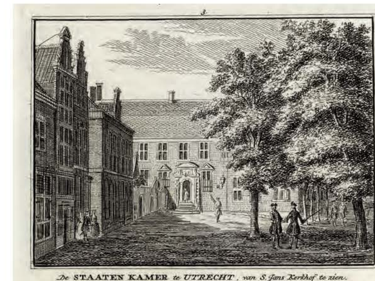
698. De Statenkamer in Utrecht Hendrik Spilman naar Jan de Beijer, 1736, 71 x 100 mm, VN, VII, nr. 3 → TS, XI, 345

Het standpunt is vrijwel identiek aan dat van een eerdere prent (→ 681): de plek ten westen van de Tollesteegpoort waar de Stadsbuitengracht een scherpe bocht naar het noordwesten maakt. De stadsrand tussen het bastion Sterrenburg en de Smeetoren, een sterrenkundig observatorium, is van net iets dichterbij weergegeven. Naast het formaat van de afbeelding is de sloep op de voorgrond het grootste verschil tussen beide prenten.