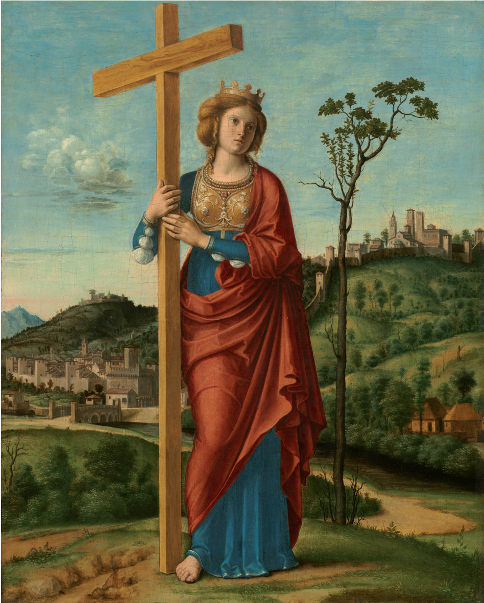
St. Helena met het gevonden kruis in Jeruzalem, Cima da Conegliano 1495