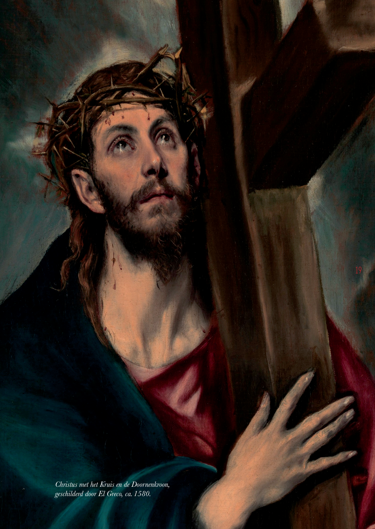
Christus met het Kruis en de Doornenkroon, geschilderd door El Greco, ca. 1580.