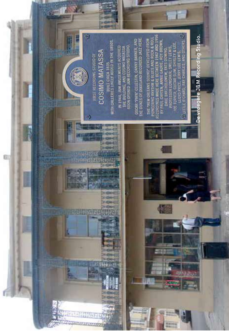
De vroegere JEM Recording Studio.

Congo Square is een belangrijke plek geweest als het gaat om de ontstaansgeschiedenis van de Amerikaanse muziek. Ik loop het plein af, steek North Rampart Street over, sla linksaf, loop tweehonderd meter door en sta voor een gebouw waar tegenwoordig een wasserette is gevestigd: Hula Mae's Tropic Wash. Het is een grote zaak, waar gigantische wasmachines in