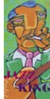
“Django”, acryl op doek | acrylic on canvas, 100 x 50 cm