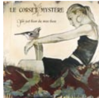
“Le corset mystère”, acryl op doek | acrylic on canvas, 140 x 140 cm