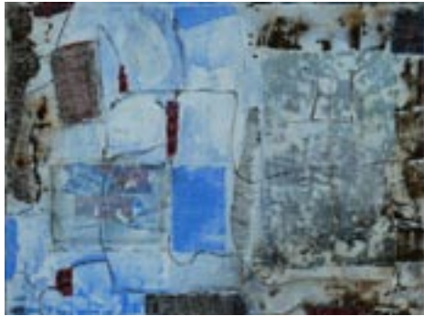
“Geen titel”, gemengde techniek | mixed media, 30 x 40 cm