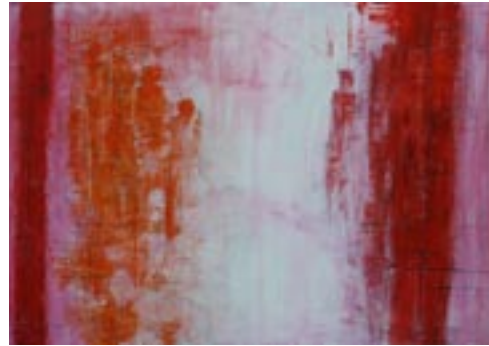
“Geen titel”, acryl op doek | acrylic on canvas, 100 x 60 cm