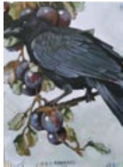
“Black crow”, acryl op doek | acrylic on canvas, 50 x 70 cm