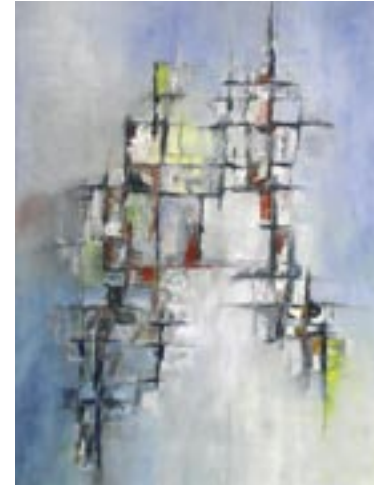
“Aankomst”, olie op doek | oil on canvas, 80 x 60 cm