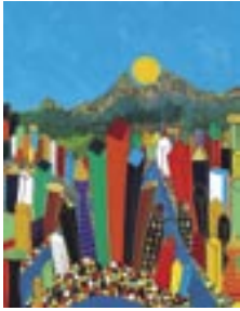
“Secret city of Asia ©2004”, acryl op katoen | acrylic on cotton, 100 x 80 cm