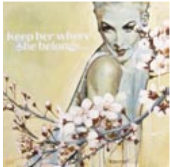
“Keep her where she belongs”, acryl op doek | acrylic on canvas, 70 x 70 cm