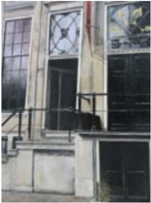
“Herengracht 368/366”, acryl op paneel | acrylic on panel, 50 x 40 cm