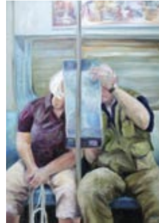
“Kleine lettertjes”, olie op doek | oil on canvas, 60 x 80 cm