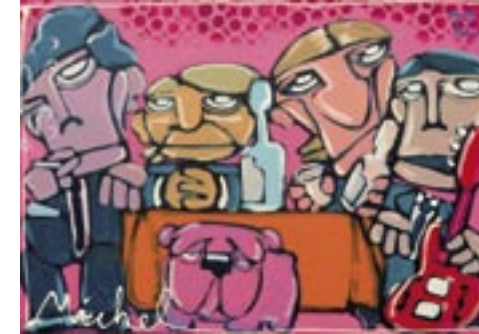
“The Jazzmasters”, acryl op doek | acrylic on canvas, 90 x 70 cm