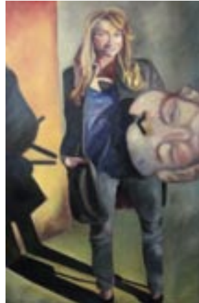
“Ready for take-off”, olie op doek | oil on canvas, 80 x 120 cm