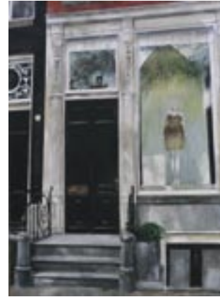
“Herengracht 176”, acryl op paneel | acrylic on panel, 60 x 40 cm