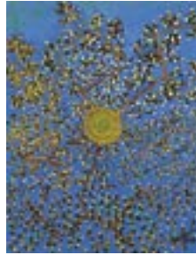
“Heavenleaves ©2002”, olie op katoen | oil on cotton, 80 x 60 cm

Het werk van Frank Dammers is een eigen variant op de geometrische abstracte schilderkunst. Gebruik makend van zijn vermogen om constructief te denken ‘bouwt’ hij als het ware zijn kleurrijke composities op het witte linnen. Zijn fascinatie voor architectuur spreekt uit de geometrische en evenwichtige opbouw van zijn composities waarin elk kleurvakje op zijn plaats valt. Op ingenieuze wijze wordt gespeeld met ruimte en perspectief waardoor zijn schilderijen het oog strelen en verbazen maar ook misleiden. Frank Dammers wordt wereldwijd uitgenodigd om zijn schilderijen te exposeren en heeft vele volgers op zijn website en social media. Het National Nine Eleven Memorial & Museum op Ground Zero in New York (opening 2014) zal zijn beroemdste schilderij “Freedom New York” opnemen in haar permanente collectie.