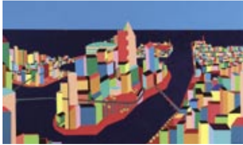
“Metropolis ©2009”, acryl op belgisch linnen | acrylic on belgian linen, 150 x 250 cm