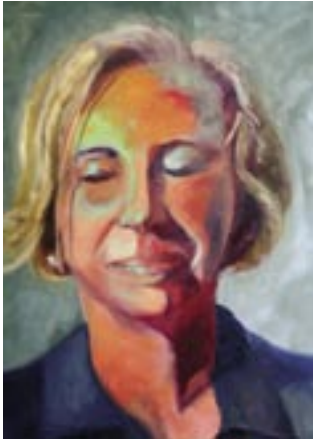
“Binnenpret”, olie op doek | oil on canvas, 40 x 50 cm