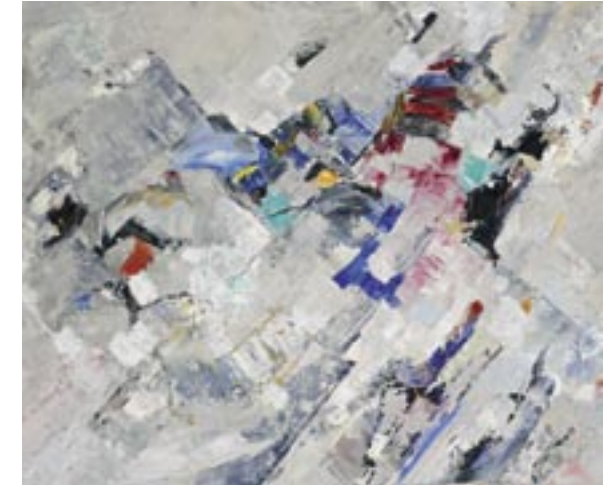
“Drukke”, olie op doek | oil on canvas, 60 x 80 cm

Voor zover ik mij herinner heb ik altijd getekend. Op de basisschool en in voortgezet onderwijs. Daar is jammer genoeg niets meer van over gebleven. Op latere leeftijd ben ik met olie- en acrylverf op doek gaan schilderen maar heb van schilderen nooit mijn vak gemaakt. Jaren geleden kwam het gevoel weer boven en ben opnieuw gaan schilderen en een opleiding gaan volgen aan de Academie voor Schone Kunsten in België. Ik heb mij nu ontwikkeld tot professioneel kunstschilder. Mijn huidige werken zijn voornamelijk abstract en geven de dingen om mij heen weer. De sfeer, de kleuren en de materie maken hierbij het schilderij.