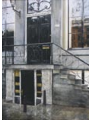
“Keizersgracht 316 in de regen”, acryl op doek | acrylic on canvas, 80 x 60 cm