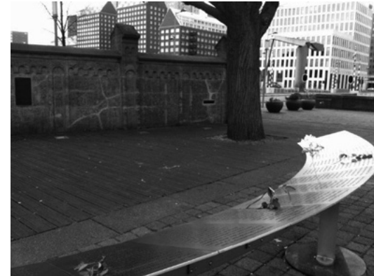
Aan de Rotterdamse Stieltjesstraat op de Kop van Zuid staan de laatste restanten van Loods 24. Een stukje muur van de omheining en de 'boom die alles zag.' Loods 24 werd in 1942 en 1943 gebruikt als verzamelplaats voor de deportatie van Joden, vergelijkbaar met de Hollandsche Schouwburg in Amsterdam. Er werden destijds via Loods 24 circa 15.000 Joden naar Westerbork gedeporteerd, waarvan 6.500 Rotterdammers. De overigen kwamen van de Zuid-Hollandse eilanden. Sinds 2013 staat hier het Joods Kindermonument.

In het Jom Hasjoa-beraad van synagogen en kerken in Rotterdam is de gedachte gegroeid om een monument op te richten waar de namen bewaard worden van de 686 Rotterdamse kinderen, die in de jaren '42 - '43 door de nazi's vermoord zijn. En om -waar mogelijk - deze kinderen een gezicht te geven, letterlijk door foto's maar vooral in de verhalen over hen. Daartoe is Stichting Joods Kindermonument in het leven geroepen.