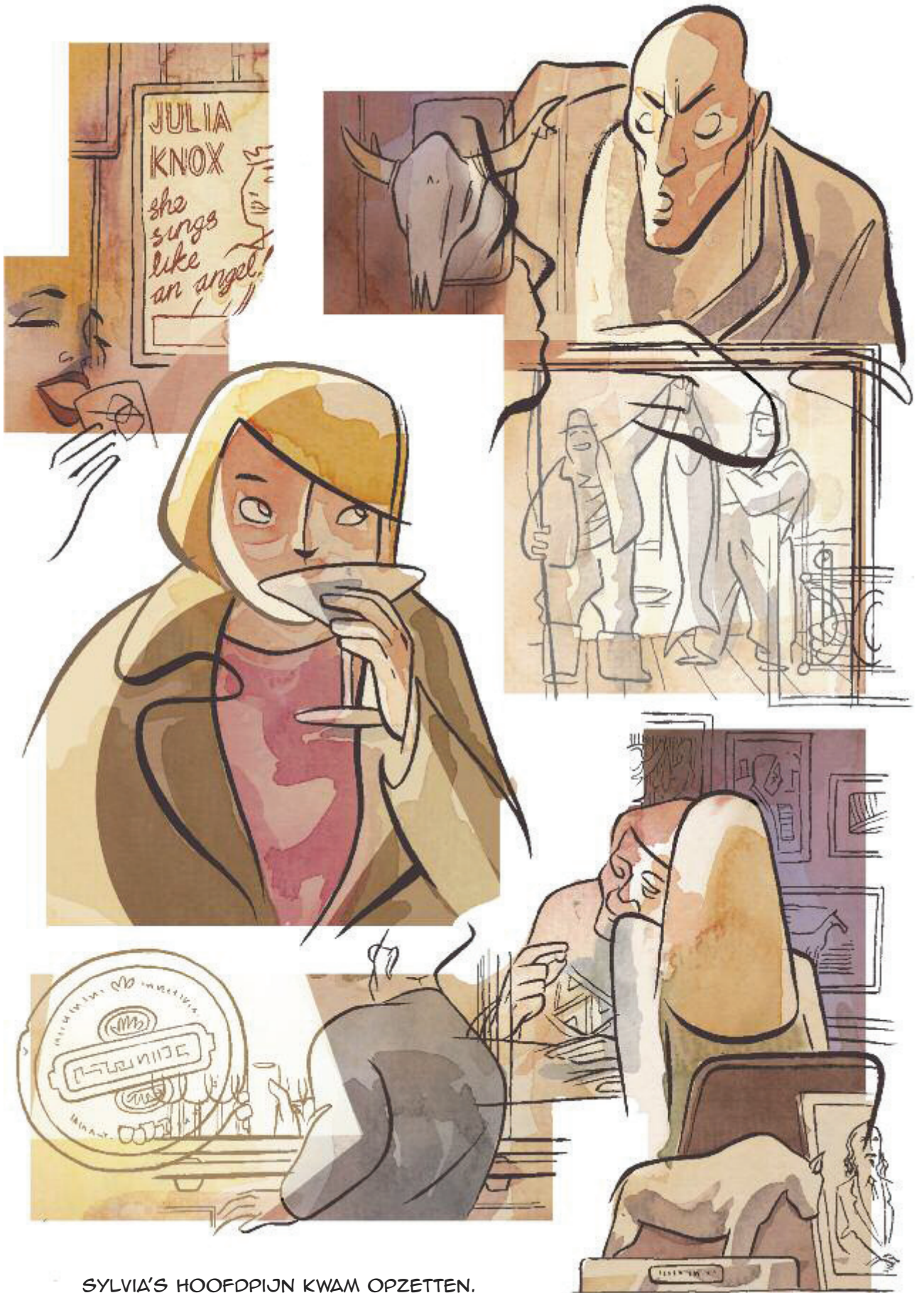
SYLVIA'S HOOFDPIJN KWAM OPZETTEN.