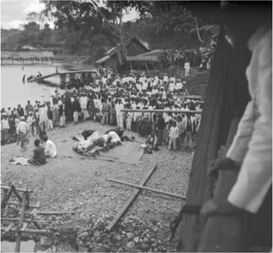
Biddende moslims, Sumatra (Zuiden van Atjeh);

Foto: Collectie Tropenmuseum. Amsterdam. Coll.nr. 10001172.