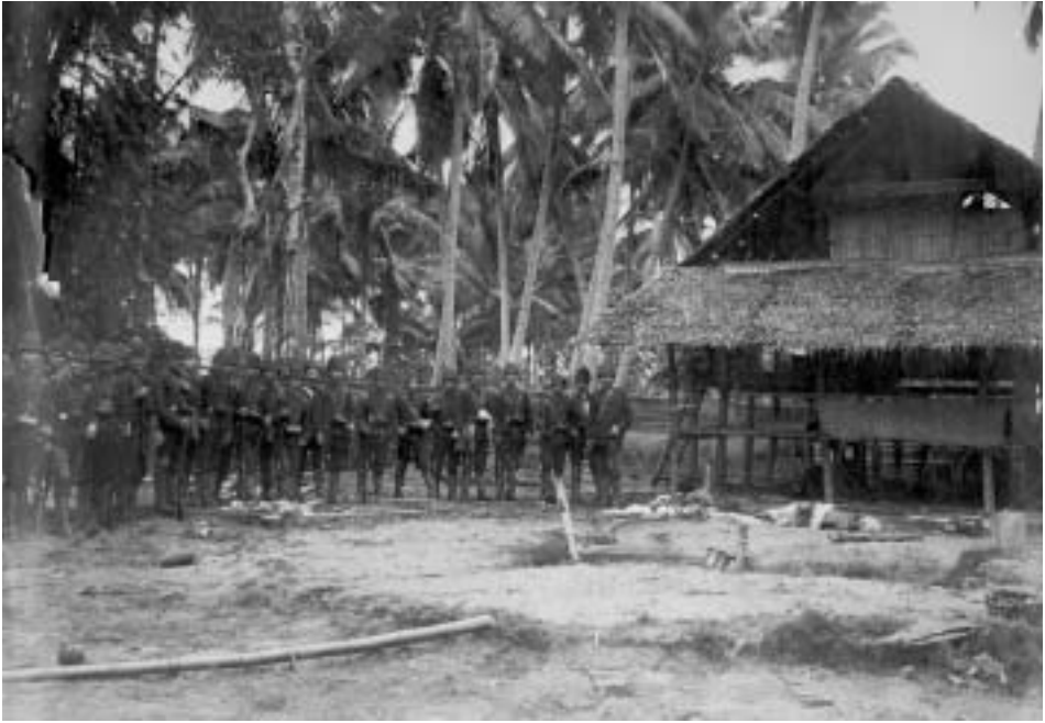
Groepsportret van militairen van het NIL die poseren in augustus 1897 bij de vermoorde inwoners (moslims, NM) van een kampong in Atjeh, nadat deze door hen is ingenomen. Rechts staat kolonel Van Heutsz, bevelhebber van de expeditie en de latere gouverneur van Atjeh. (Shatanawi, 2009: 237) Alleen door het systematisch uitroeien van de inlandse verzetsstrijders die hun land niet door Nederlanders wilden laten bezetten, kon Oost-Indië voor Nederland tot 1949 behouden blijven. Foto: Collectie Tropenmuseum. Amsterdam. Coll.nr. 60029845.

De meerderheid van de miljoenenbevolking van Oost-Indië is moslim. In de verzetsstrijd van de moslimhoofden in Atjeh (Koeta-Sawang) in 1897 tegen Van Heutsz werden de moslims opgeroepen 'tot deelname aan den heiligen oorlog.' (Rullmann, 1933: 16)