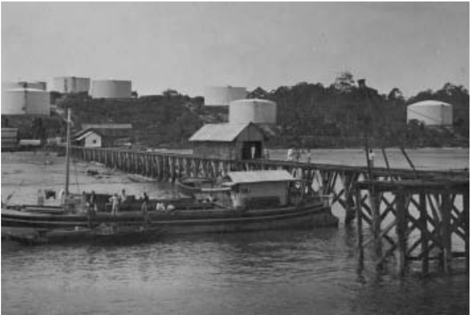
Steiger en olietanks van de Bataafsche Petroleum Maatschappij (BPM) op het eiland Tarakan. Tekst en Foto: Collectie Tropenmuseum. Amsterdam. Coll.nr. 60018735.

Voor deze petroleum en andere producten uit de Oost heeft de oorspronkelijke bevolking een heel hoge prijs betaald.