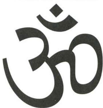
Afb. 1.3: Aum-teken

een jaar waarin we alle westerse vakken een week bestudeerden in het licht van Vedanta filosofie. Dit pad heb ik continu doorgetrokken. Diverse jaren van mijn leven beoefende ik drie uur per dag yoga en meditatie. Met een groep andere mensen deed ik soms maandenlang niets anders. We lazen geen krant, keken niet naar de televisie en belden niet naar buiten om onze aandacht helemaal naar binnen te keren. Zo maakte ik contact met de mythische Shiva; 'de God van vernietiging', zoals hij het meest bekend staat. Ik voelde een enorme aantrekkingskracht tot hem, maar begreep destijds niet wat nou zo interessant was aan vernietiging. Pas nu