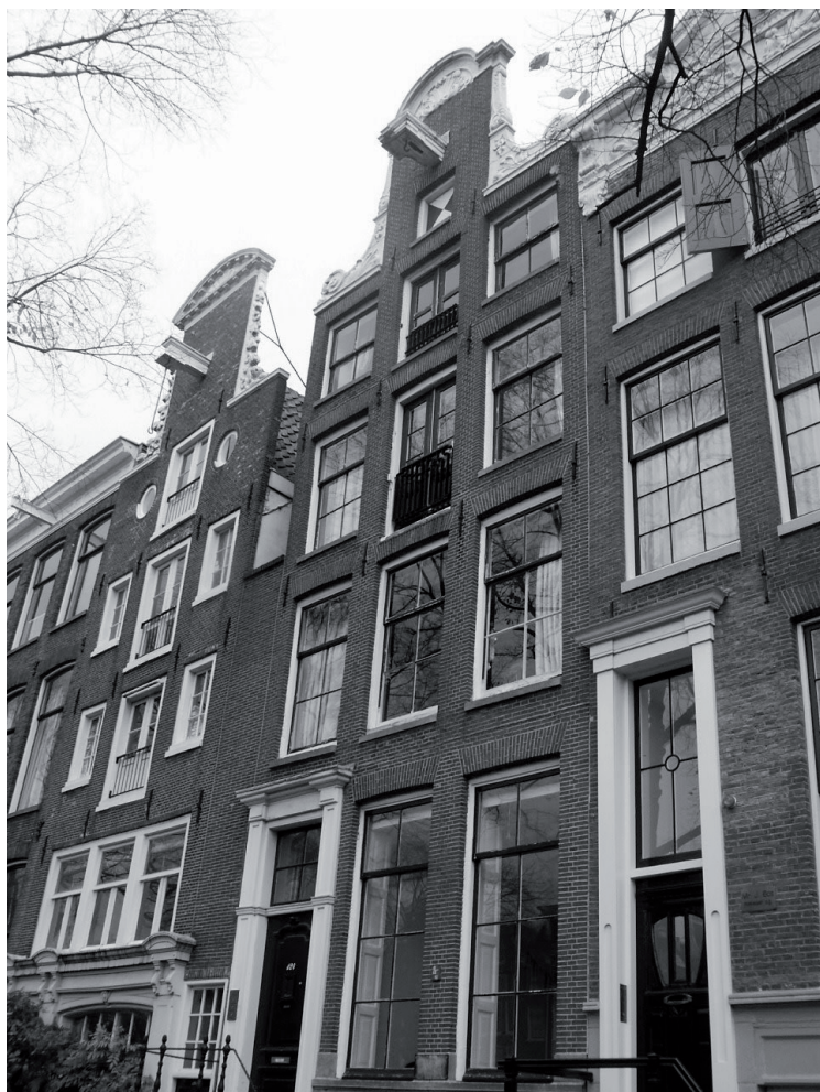
Brouwersgracht 124 (foto auteur; 5 juni 2006)