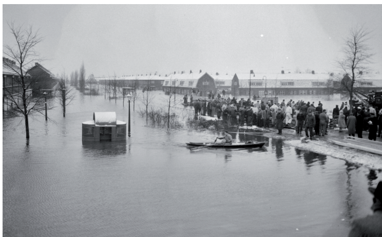
Een trieste aanblik: Tuindorp Oostzaan 14 januari 1960