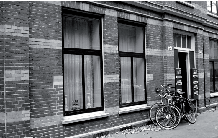
Van Houweningenstraat 74 (foto auteur, 20 november 2007)