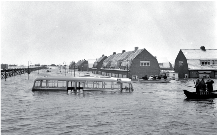
Tuindorp Oostzaan, 14 januari 1960