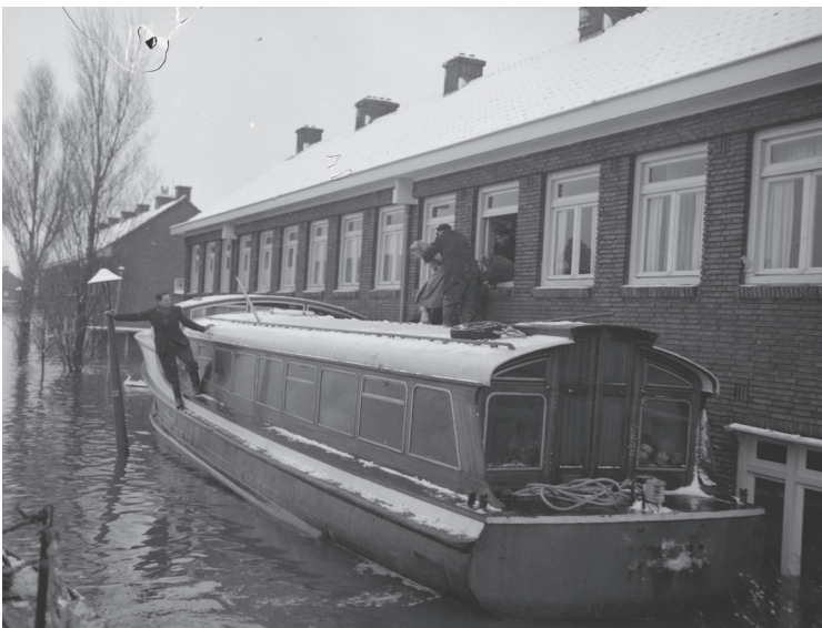
Toen het water steeg konden mensen ook met grotere vaartuigen uit hun huizen worden gehaald