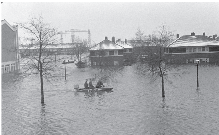
14 januari 1960 (ook foto omslag)