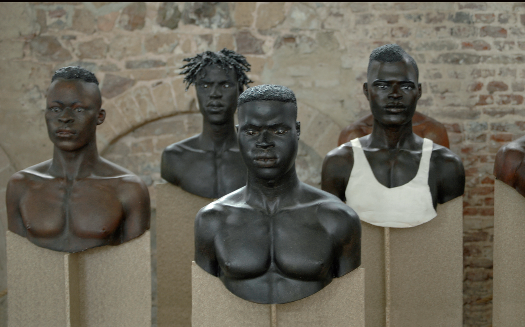
EXPOSITIE PORTRETTE VAN AFRIKAANSE VLUCHTELINGEN IN 'T KERKJE IN GRAVE / EXPOSITION DE PORTRAITS DE RÉFUGIÉS AFRICAINS À "T KERKJE" DE GRAVE, 2005 (PV)