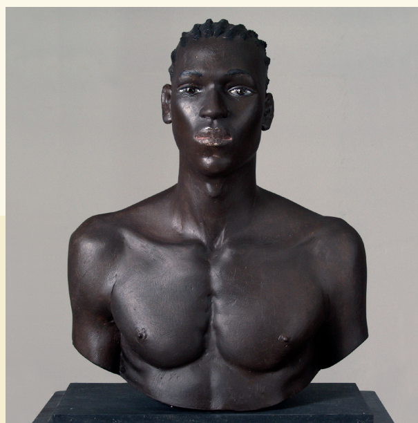
GIPSEN PORTRET / PORTRAIT EN PLÂTRE (PV)

De tijd is inmiddels voortschreden: de schrille tegenstelling abstract-figuratief is verdwenen en doet nu