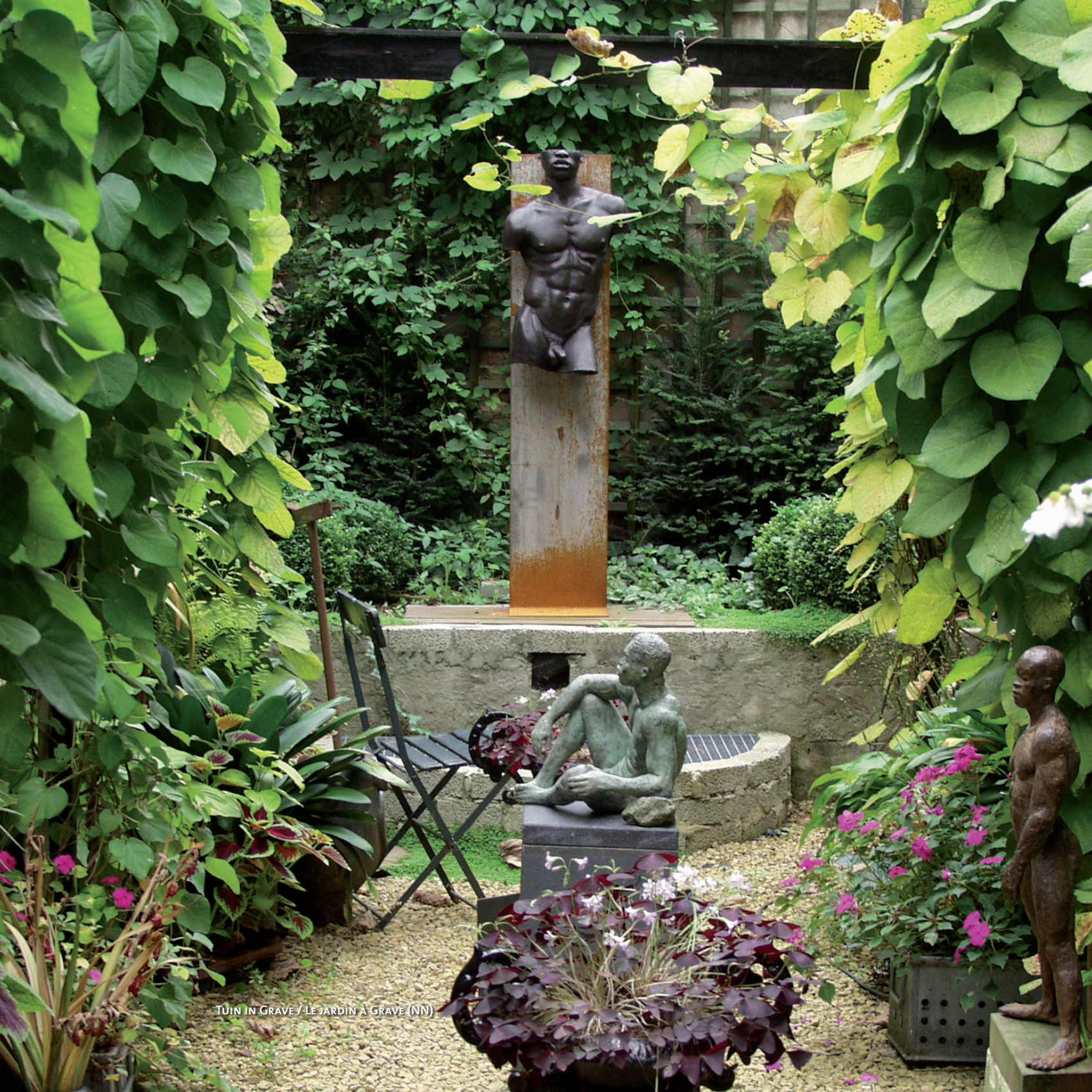
TUIN IN GRAVE / LE JARDIN À GRAVE (NN)