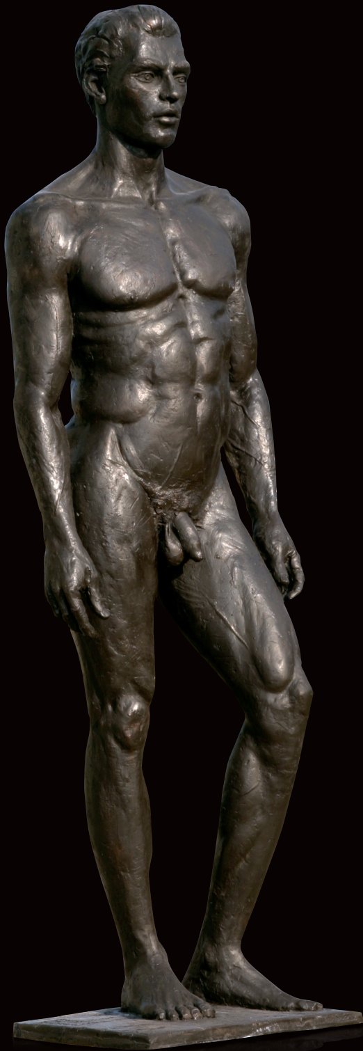
MIQUEL BRONS / BRONZE WARE GROOTTE / GRANDEUR NATURE 1994 (AJ/PV)