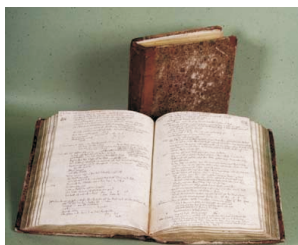
Een voorbeeld van de Krankenjournalen.

Je ziet in de boeken tot en met D34 nog regelmatig dat hij korrels voorschrijft (waarbij het niet duidelijk is of die opgelost moeten worden of niet). Vanaf D35 zie je in toenemende mate reukpotenties, waarbij de korrels in een flesje bevochtigd worden met een paar druppels wijngest. Hij werkt heel veel met placebo's, waarschijnlijk om de mensen elke dag iets te kunnen laten innemen of ruiken. Eens in de paar dagen, soms weken, mogen ze het middel weer ruiken of innemen i.p.v. de placebo.