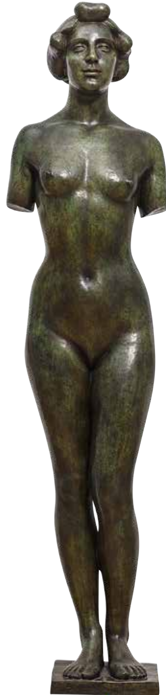
ARISTIDE MAILLOL Lente (zonder armen) cat. 8