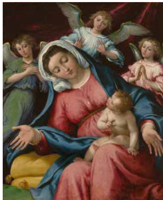
LORENZO LOTTO Madonna delle grazie cat. 14