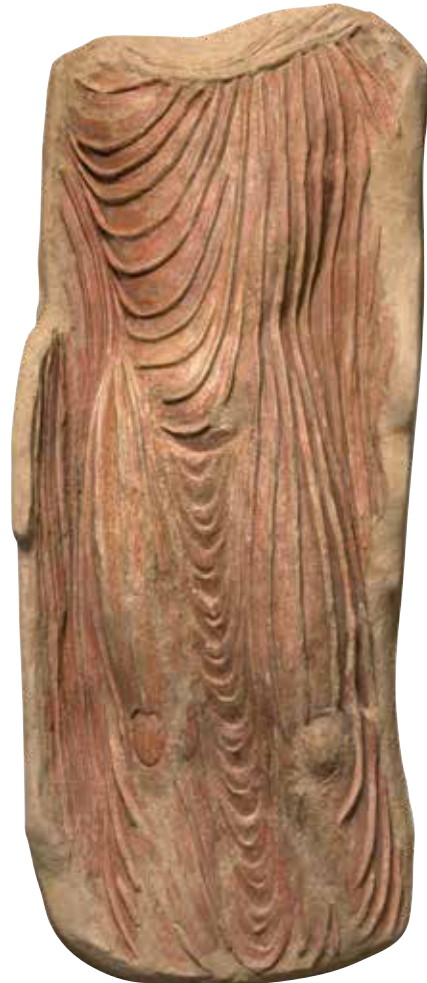
Fragment van een Boedha