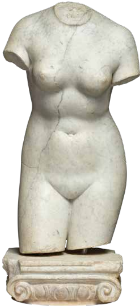
Torso van Afrodite op een volutenkapiteel Rome cat. 7