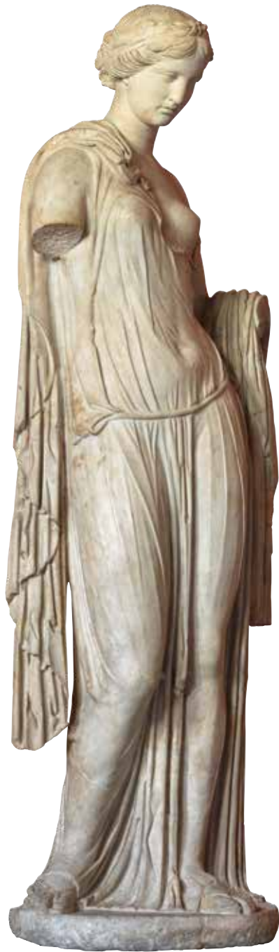
Afrodite (Venus van Nani)