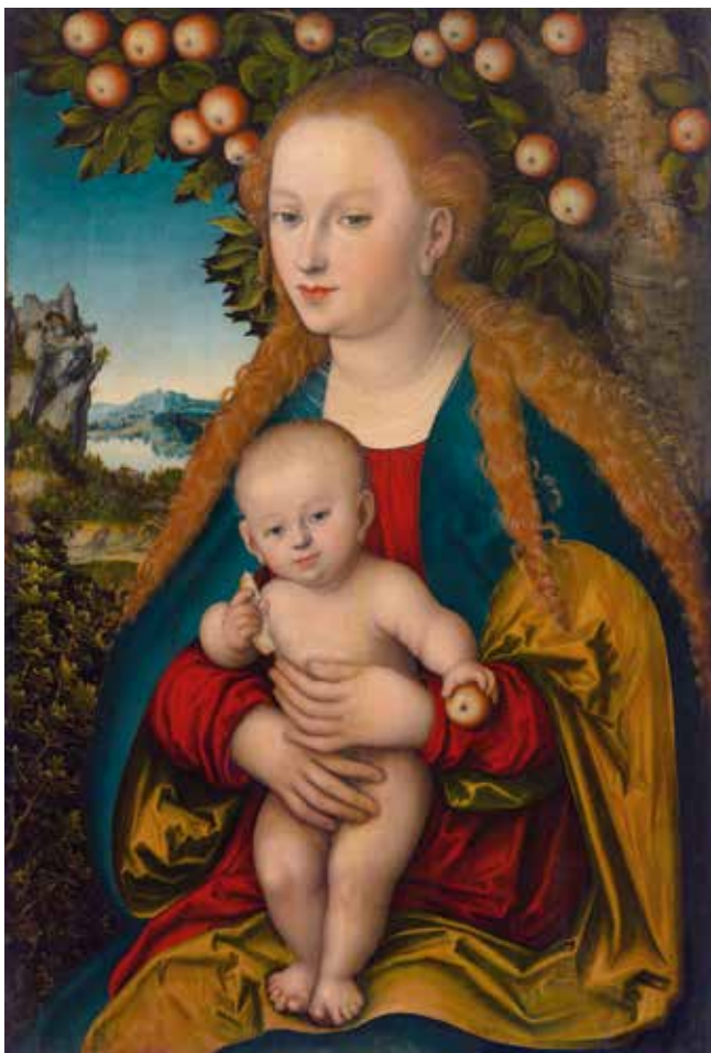
LUCAS CRANACH DE OUDERE Maria met Kind onder een appelboom cat. 13