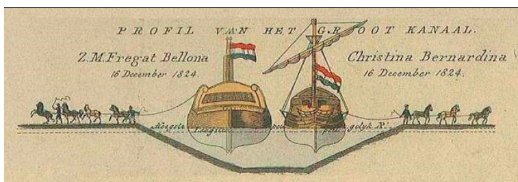
Figuur 3: Bellona door het Noordzeekanaal 1824