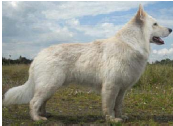
“De witte Herder was als een droom!”