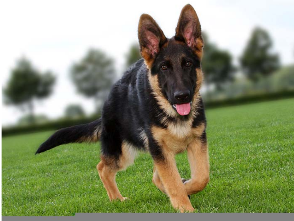
Herta als Pup