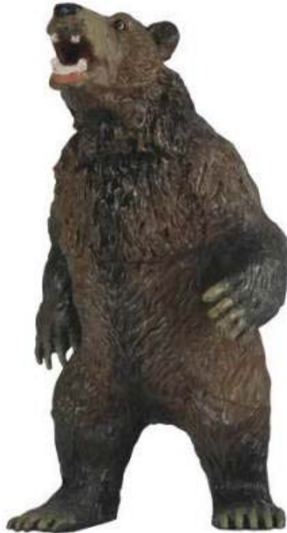
Intimiterende Grizzly- beer

ijselijk - door merg en been dringend wolvengehuil - uit, dat de beer terugschrok en stil bleef staan. Het was het geheime