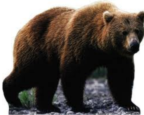
Bruine Grizzly beer

Maar Herta begon noch harder te grommen en zijn lippen krulden hoog op. Nu zag Max wat er aan de hand was. Uit het struikgewas kwam een grote bruine beer die stil naar hen bleef staren. Zou hij kwaad in zijn schild voeren? Max werd toch wel bang en kroop tegen Herta aan.