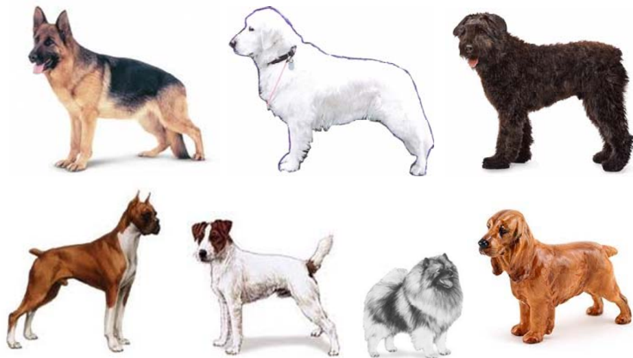
De nieuwe roedel van Herta

Ook allemaal ongelijk van kleur: blank, bruin en zwart. Ongelijk, maar wel gelijkwaardig, ook als reu en teef. Als dikke vrienden lopen ze naast en achter elkaar. “Kijk nou toch eens!”