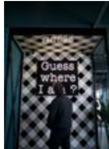
Full steam ahead 130