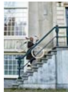
At home in Amsterdam 86