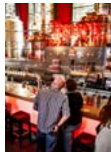
Haarlem's Pride 42