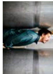
City of contradictions 144