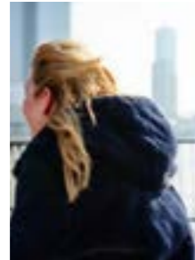
Self-made business woman 116