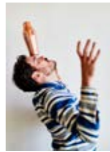
The higher the better 184