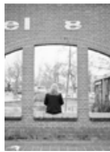
Ticking all the boxes 172