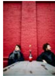
From IJ to Jan Eef 10