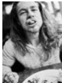
Chef with balls 26