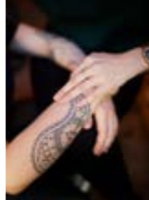
But first coffee 196