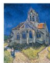
p 175 Auvers-sur-Oise, 1890 Musée d'Orsay, Paris