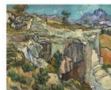
p 150 Saino-Rémy-de-Provence, 1889 Musée d'Orsay, Paris