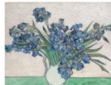
p 145 Saino-Rémy-de-Provence, 1889 The Metropolitan Museum of Art, New York