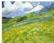
p 134-135 Saino-Rémy-de-Provence, 1889 Ny Carlsberg Glyptotek, Copenhagen