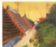
p 118 Saino-Maries-de-la-Mer, 1888 Kimbell Art Museum, For Worth, Texas