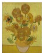
p 97 Arles, 1889 Van Gogh Museum, Amsterdam (Vincent van Gogh Stichting)