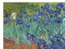
p 144 Saino-Rémy-de-Provence, 1889 Paul Geary Museum, Los Angeles