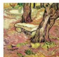
p 136 Saino-Rémy-de-Provence, 1889 Museo de Arte de Sao Paulo