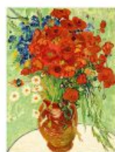
p 163 Auvers-sur-Oise, 1890 Private Collection