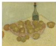
p 98 Arles, 1888 Kröller-Müller Museum, Oslo