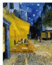
p 127 Arles, 1889 Kröller-Müller Museum, Oslo