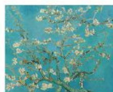
p 153 Saino-Rémy-de-Provence, 1890 Van Gogh Museum, Amsterdam (Vincent van Gogh Stichting)