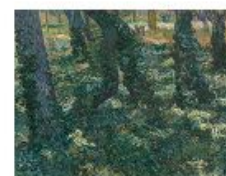
p 140 Saino-Rémy-de-Provence, 1889 Van Gogh Museum, Amsterdam (Vincent van Gogh Stichting)