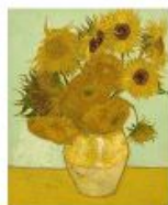
p 95 Arles, 1888 Neue Pinakothek, München