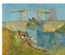
p 120-121 Arles, 1888 Kröller-Müller Museum, Oslo