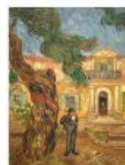
p 137 Saino-Rémy-de-Provence, 1889 Musée d'Orsay, Paris