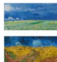
p 168-169 Auvers-sur-Oise, 1890 p 171-175 Auvers-sur-Oise, 1890 Van Gogh Museum, Amsterdam (Vincent van Gogh Stichting)