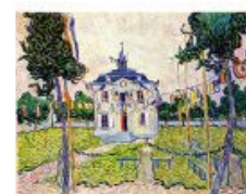
p 154 Auvers-sur-Oise, 1890 Private collection