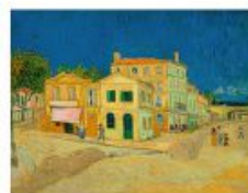
p 92-93 Arles, 1888 Van Gogh Museum, Amsterdam (Vincent van Gogh Stichting)