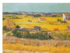
p 110-111 Paris, 1888 Van Gogh Museum, Amsterdam (Vincent van Gogh Stichting)