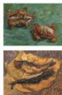
p 100 Arles, 1889 National Gallery p 101 Arles, 1889 Private collection