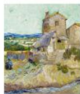
p 90 Arles, 1888 Albright-Knox Gallery, Buffalo, New York