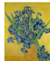
p 147 Saino-Rémy-de-Provence, 1890 Van Gogh Museum, Amsterdam (Vincent van Gogh Stichting)