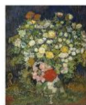
p 161 Auvers-sur-Oise, 1890 The Metropolitan Museum of Art, New York