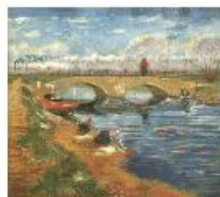
p 108 Arles, 1888 Pola Museum of Art, Japan