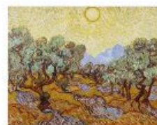
p 130-131 Saino-Rémy-de-Provence, 1889 Minneapolis Institute of Art