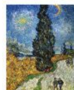
p 143 Saino-Rémy-de-Provence, 1889 Kröller-Müller Museum, Oslo