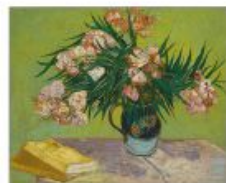
p 99 Arles, 1888 The Metropolitan Museum of Art, New York