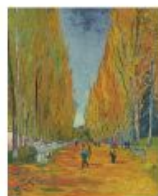
p 122 Arles, 1888 Private Collection