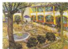
p 114-115 Arles, 1889 The Oskar Reinhart Collection, Winterthur