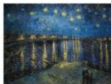
p 128-129 Arles, 1889 Musée d'Orsay, Paris