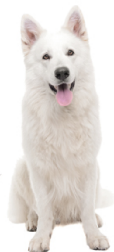
De Zwitserse witte herder VERZORGING

De oren van je Zwitserse witte herder kun je eenvoudig schoonmaken met een hydrofiel gaasje of een schone tissue en een beetje (baby)olie. Overtollig oorsmeer en zandkorrels poets je hiermee vlot weg. Eventueel kun je hiervoor ook een speciale oorcleaner (bij voorkeur zonder alcohol) gebruiken. Maak alleen de oorschelp schoon en laat het schoonmaken van de gehooringang - indien nodig - altijd over aan de dierenarts. Is de oorschelp rood en geïrriteerd? Komt er een onaangename geur uit de oren van je hond? Dan is er mogelijk sprake van oormijt of van een oorontsteking. Neem bij deze symptomen altijd contact op met je dierenarts.