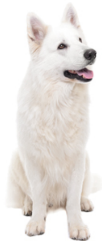
De Zwitserse witte herder AANSCHAF

Ben je vooral op zoek naar 'slechts' een gezellige huisgenoot of heb je ook show- of fokambities? Of is je keuze juist op de Zwitserse witte herder gevallen vanwege zijn werkeigenschappen en wil je met hem gaan werken of sporten? Binnen een ras heb je vrijwel altijd met verschil in type en temperament te maken. Dat geldt ook voor dit ras. Er zijn fokkers die primair selecteren en fokken op werkeigenschappen, maar er zijn er ook die zich meer op andere karaktereigenschappen of uiterlijke raskenmerken richten. Als je serieus overweegt om te gaan showen, fokken of werken met je herder, dan doe je er verstandig aan om je eerst uitgebreid in het ras, de rasstandaard