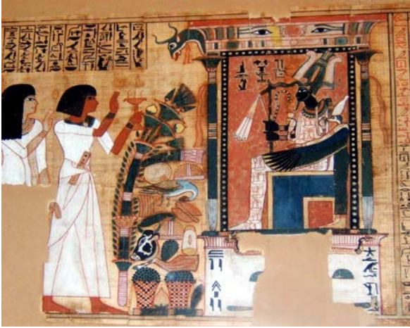
Overledenen komen aan bij de god van het dodenrijk Osiris, zoals weergegeven in een dodenboek uit de 14 e eeuw voor Chr.

Het Egyptische dodenboek stamt uit de tijd van het Nieuwe Rijk. Het is een boek dat in de 19 e eeuw voor Chr. werd samengesteld op basis van gevonden papyrus, piramidetekeningen, grafteksten, etc. Het beschrijft het oordeel dat de overledene moest ondergaan. De farao was uitgezonderd van dit oordeel omdat hij zich meteen bij de goden mocht voegen. Meteen na zijn dood moest de overledene een tocht met een boot maken. Om deze tocht goed door te