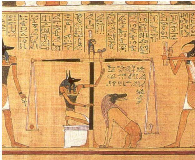
Het hart van de overledene wordt gewogen op de weegschaal door de god Anubis. Naast hem staat het beest Ammut die de overledene op zal eten indien het hart te zwaar is.

helpen zich deze te herinneren. Aan het einde van de reis mocht de dode naar het huis van Osiris, waar de god Anubis (de godheid met het hoofd van een jakhals) de overledene begeleidde. Daarna kwam hij in de gerechtshal, waar het hart van de overledene op een weegschaal werd gelegd en afgewogen tegen de veer van de god Ma'at. Overledenen die goed