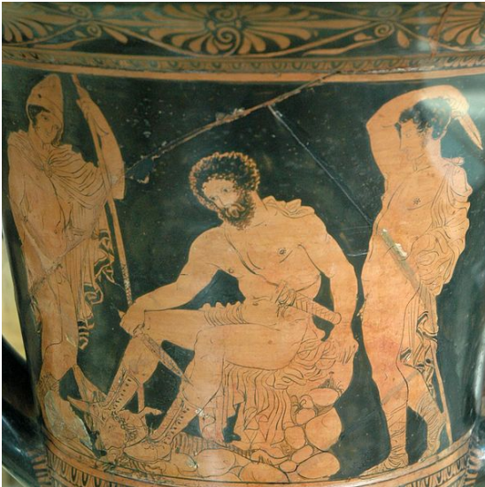
Odysseus in de donkere onderwereld.

De onderwereld, door de Grieken de Hades genoemd, was donker en somber. Het was er mistig en de zon scheen er nooit. Het was de plaats waar de ziel, de niet-lichamelijke kern van de mens, naar toe ging. Om in de onderwereld te komen moest de overledene samen met de bootman Charon de rivier de Styx oversteken. Homerus schief dat de doden niet worden beoordeeld op basis van moreel goed of slecht gedrag, maar op hun mannelijkheid en hun dapperheid. Ook de sociale status van de overledene was van belang. Odysseus