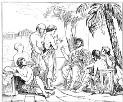
Plato in zijn academie.

Plato beschrijft in de vierde eeuw voor Chr. het leven van Socrates die erom bekend stond dat hij zocht naar de diepere drijfveren van mensen en daarbij onrechtvaardigheid wist te ontmaskeren. Plato schrijft hoe Socrates op een heldhaftige manier sterft nadat hij door het bestuur van Athene is veroordeeld tot het drinken van de gifbeker. Volgens de aanklacht zou Socrates niet de goden van de stad erkennen en andere nieuwe goddelijke wezens introduceren.