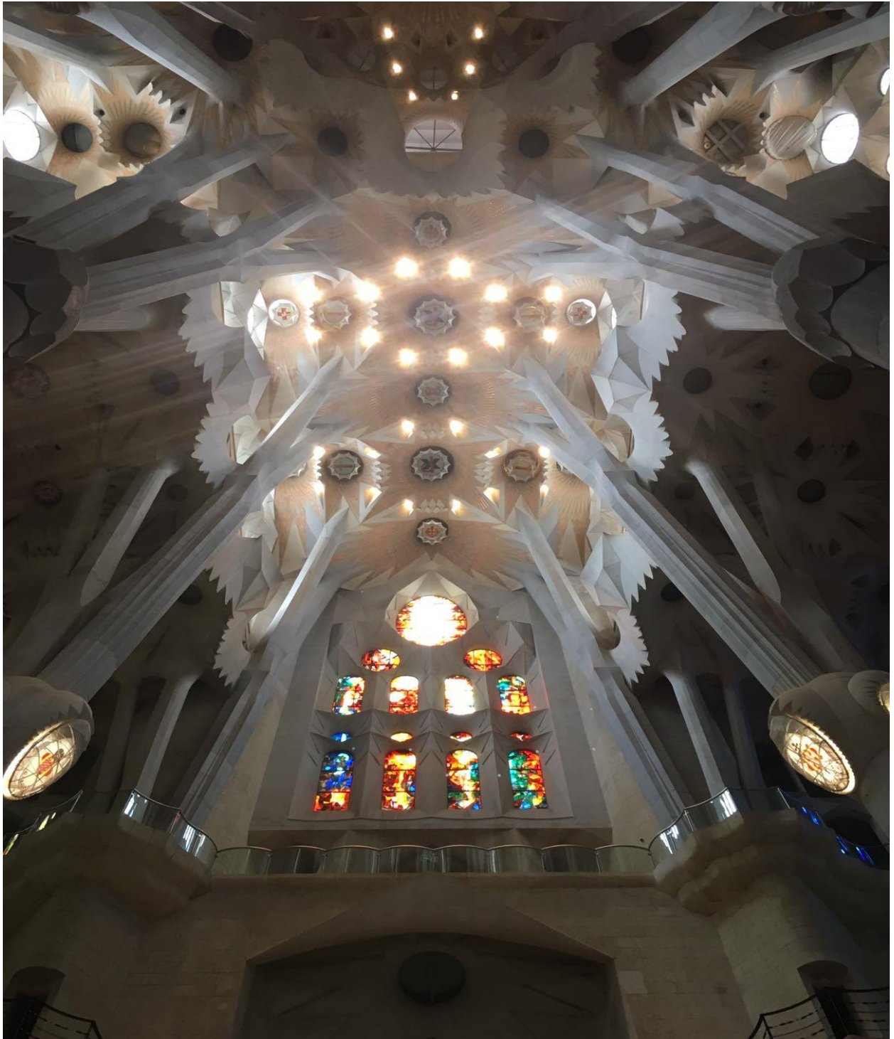
Het plafond van de beroemde basiliek in Barcelona de 'Sagrada Família' ofwel: Basílica i Temple Expiatori de la Sagrada Família . (Basiliek en Boetetempel van de Heilige Familie ). Gebouwd naar een ontwerp van Antoni Gaudí .