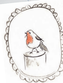
TIK, HET ROODBORSTJE

Tik, het roodborstje, dat ooit was komen aanvliegen en nu bij Robins kamer elke dag even tegen het raam kwam tikken, was het daar helemaal mee eens.