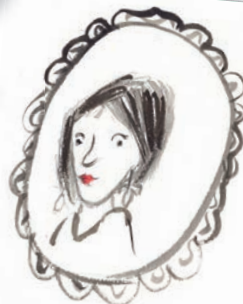
ROBINS JUF NINA