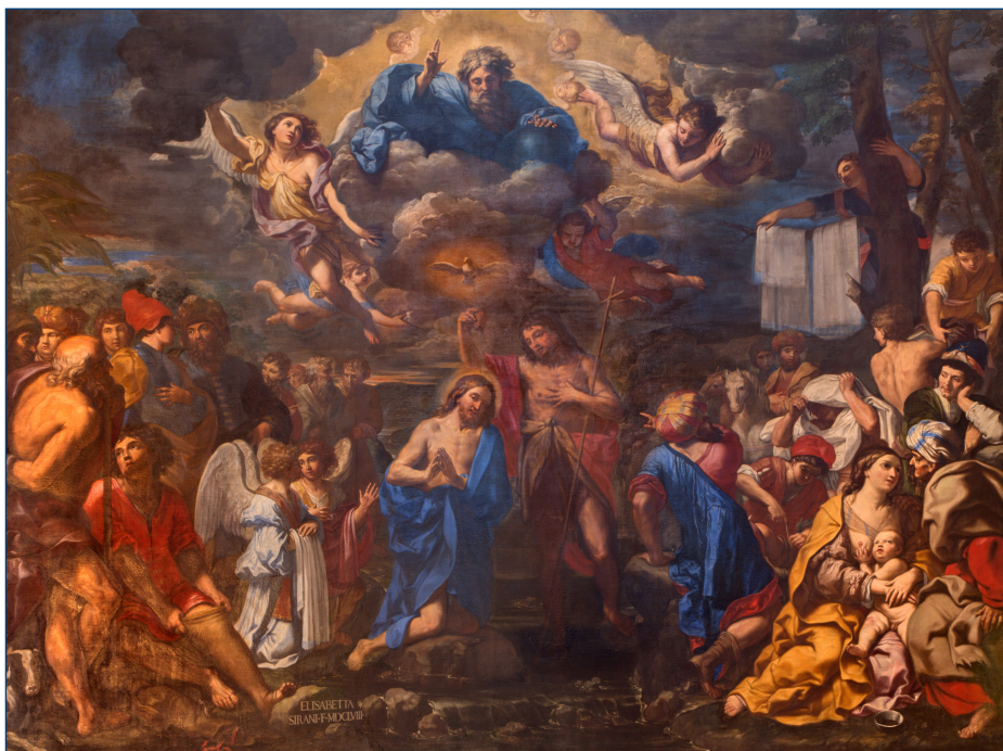
De doop van Christus , door Elisabet Sirani, 1658. (De San Girolamo della Certosa kerk in Bologna, Italië)

Jezus en Johannes zien er hetzelfde uit. Hun mantels hebben verschillende kleuren. Naast hen staat een man die beide kleuren draagt en die naar Johannes wijst. Boven hen hangt een engel die ook de twee kleuren gecombineerd draagt.