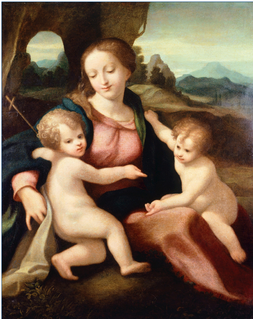
The Madonna van Casalmaggiore (copie), door Antonio Allegri, bekend als Correggio, circa 1522. (Städelsches Kunstinstitut Und Städtische Galerie, Frankfurt)

Jezus en Johannes zien er hetzelfde uit en wijzen naar elkaar. Maria kijkt naar Johannes.