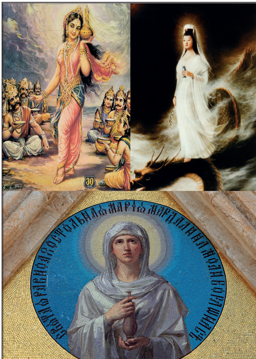
Amrita-symboliek in verschillende wereldgodsdiensten Boven links: Mohini Devi (een avatar van Vischnoe) – hindoeïsme Boven rechts: Quan Yin – boeddhisme, taoïsme. Onder: Maria Magdalena – christendom