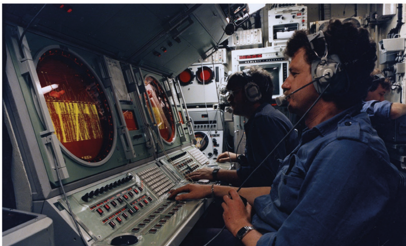
Sonaroperators in de commandocentrale van Hr.Ms. Tijgerhaai (Zwaardvisklasse) na de modernisering, maart 1989.

Het onopgemerkt binnenvaren van de Middellandse Zee is normaal gesproken ook voor een onderzeeboot een hele klus, nu de bewaking van het fort een oefening bij de poort hield, was het helemaal een hels karwei voor de Zwaardvis . Toch is de stille, onder water varende onderzeeboot zelfs dan nog in het voordeel. Bovendien hadden Hermsen en zijn team zich lang voorbereid en een goed plan bedacht.