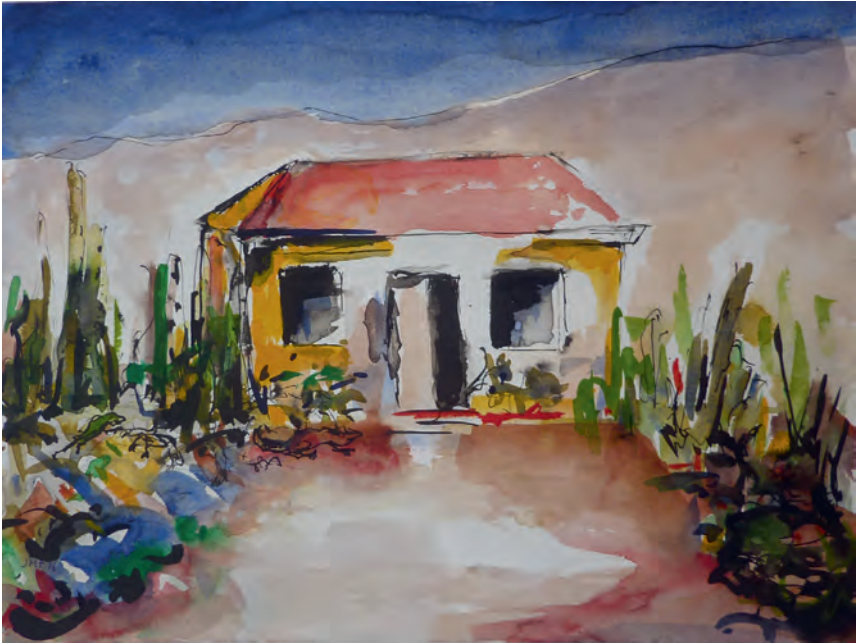
Kunukuhuisje op weg naar Daaibooibaai