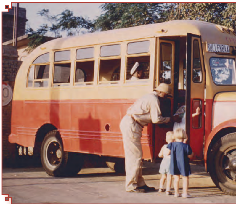
De bus naar Bullenbaai Foto 1949