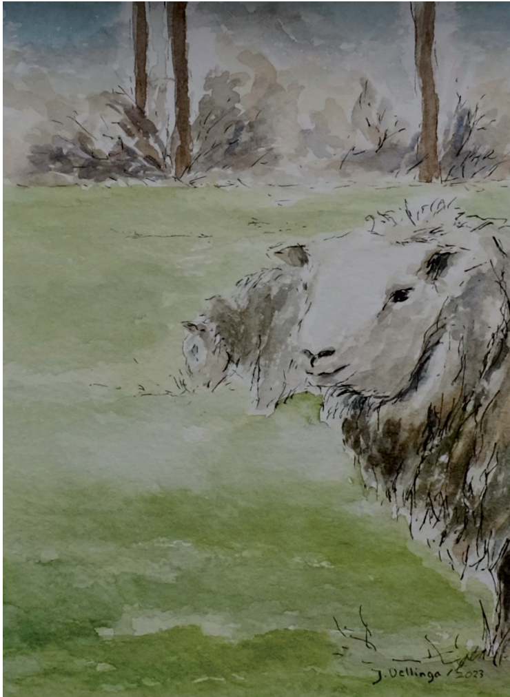
Schape aquarel en inkt, 15x10 cm, 2023