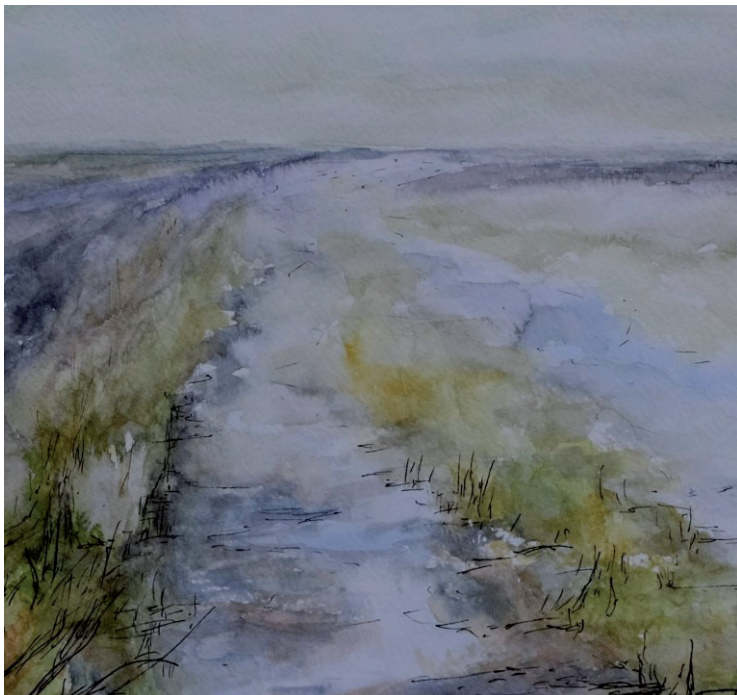
Landweg aquarel en inkt, 18x18 cm, 2020