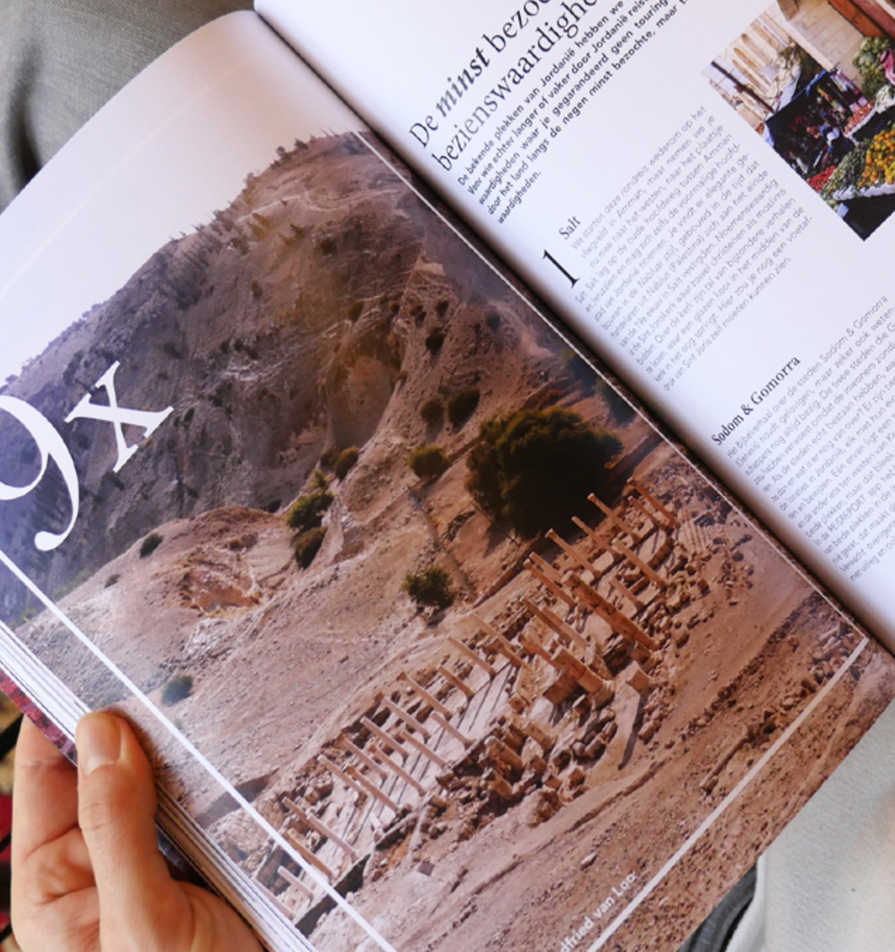
door Goelfried van Looy