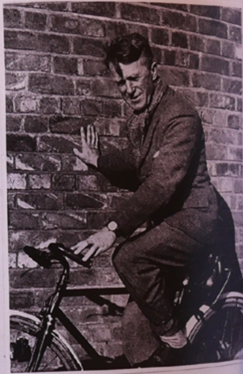
Lawrence leaving Bridlington on his discharge from the R.A.F., 26 February 1935.