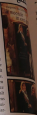
Poema Pocket, €18

In Ik woonde in een grot vertelt Marguerite Geldermalsen openhartig over haar bijzondere leven en gunt ze ons een kijkje in het dagelijks leven van de Bedoeïenen.