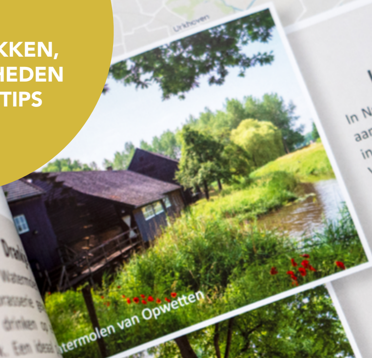
Watermolen van Opwetten

Draai Bij de Watermolen een brasserie op wat drinken op plek. Een ideaal te stoppen. In Nuenen Lindehof en bij