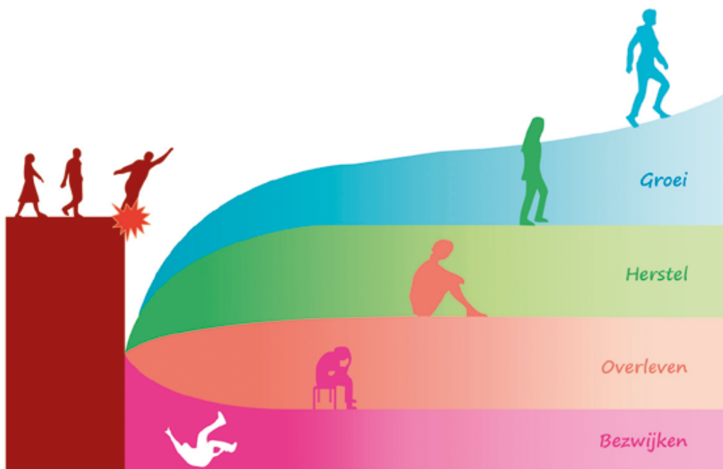
Figuur 1. Mogelijkheden na tegenslag, een moeilijke periode of een trauma

De meeste mensen hebben van nature niet zo'n grote 'veranderbereidheid'. Pas als het ergens echt pijn gaat doen, wordt die veranderbereidheid een stuk groter. Daardoor kunnen we een moeilijke periode ook positief gebruiken om een groeispurt te realiseren. In de wetenschap heet dat fenomeen 'PostTraumatische Groei' (PTG).