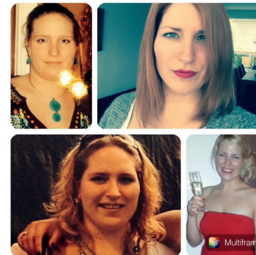
De foto's die ik meestuurde als ik de media benaderde, mijn voor- en na foto's (20-23 jaar & 32 jaar).