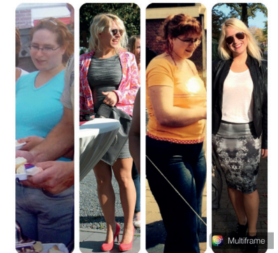
Rechts (op alle foto's) ben ik niet alleen 10 jaar ouder, maar ook ruim 20 kilo lichter.