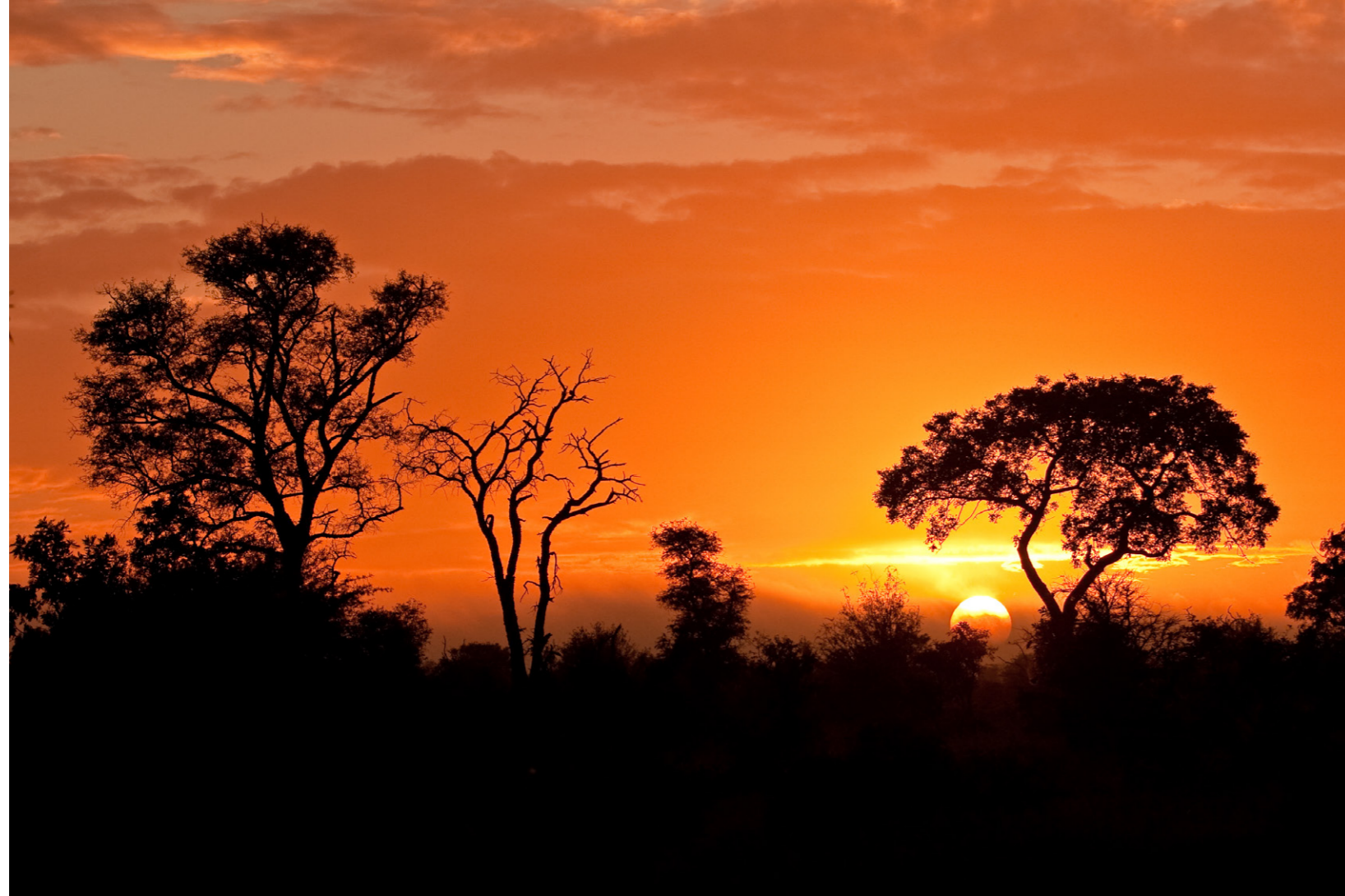
Vorige links: de Afrikaanse leeuw. Leeuwen leven in groepen, waarin vrouwtjes de baas zijn. Soms liggen leeuwen wel 20 uur per dag te rusten in de schaduw, tot ze gaan drinken of jagen. Vorige rechts: impala's, oftewel rooibokken, leven in groepen en ze kunnen wel 10 meter ver en 3 meter hoog springen. Boven en rechts: het avontuurlijke Kruger National Park (3).